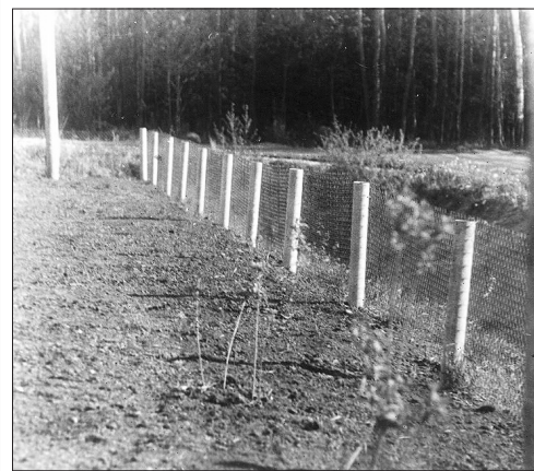
Tāds Levicu ģimenes dārzs izskatījās 1991. gada pavasarā.