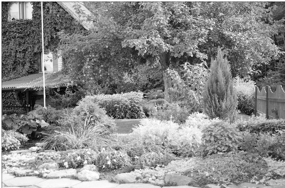
Tā pati vieta šodien.