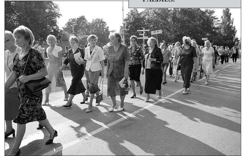
Jubilejas viesi svētku gājienā.

Paldies, skolotāj! Paldies, ka bijāt jūs, Un jūsu sirdis siltās Paldies, ka cietāt mūs Un mūsu nedarbus un blēņas Paldies par visu to, Ko darijāt un cietāt Par visu to, ko paturējāt sevī PALDIES! PALDIES!