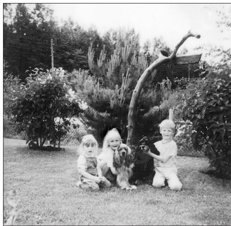
Šādi vieta pie vārtiņiem izskatījās pēc 3 gadiem