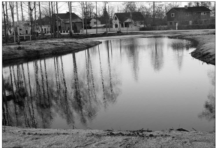
Ar pašvaldības finansējumu esošo ūdens ņemšanas vietu pārveidoja par ainavisku dīķi.

uzvarēja un, ja minētais projekts tiks apstiprināts Eiropas Zivsaimniecības fonda Lauku atbalsta dienesta konkursā, parka aprikojumu uzstādīs SIA „Laumas”. Ļoti ceram, ka izdosies.