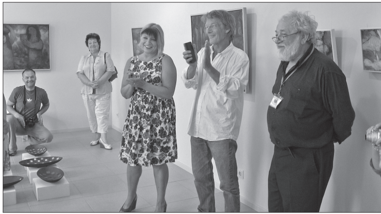
Mākslinieki no mūsu sadraudzības pilsētas Valdemārsvikas izstādes atklāšanā Rojas muzejā.