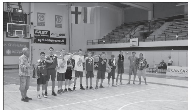
Apvienotā basketbola komanda un treneris.