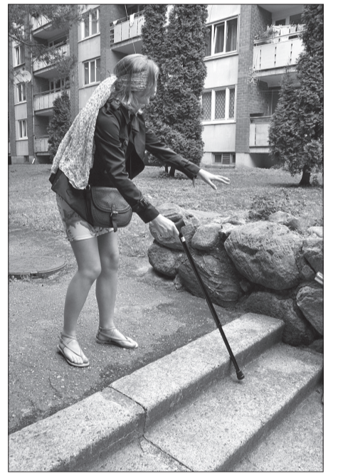
Izskatās, ka šai meitenei nokāpt pa kāpnēm būs visai grūti.