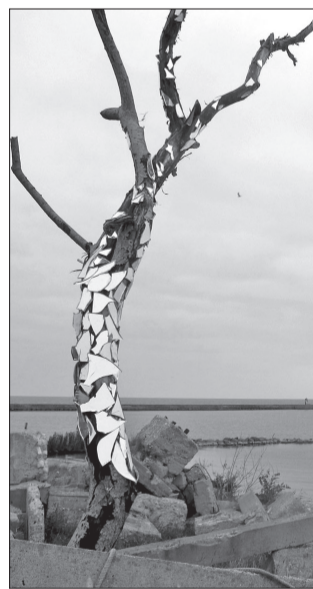
Viens no jaunajiem mākslas objektiem.