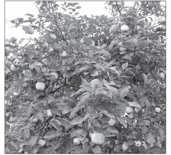
22. septembrī 17.49 iestājās astronomiskais rudens. Šogad tas sevi pieteica ne tikai ar nemitīgām lietussgāzēm, ko dažviet papildina pērkonis un zibens, bet arī ar kārtīgu ābolu ražu – vietām zari vai lūst no sārtvaidžu pārpilnības.

Vēl arvien smagi virzās atkritumu apsaimniekošanas jautājums, jo nevaram vienoties ar SIA „Eco Baltia vide” par līguma nosacījumiem, kas skar pašvaldības iestāžu un šķiroto konteinere apsaimniekošanu un jaunu šķiroto atkritumu konteinere vietu ierīkošanu. Pašvaldība ir sūtījusi priekšlikumus līguma nosacījumiem, bijušas tikšanās, ir notikusi elektroniska informācijas apmaiņa, esam vērsušies Patērētāju tiesību birojā, bet rezultāta arvien vēl nav. Esam vērsušies pie atkritumu apsaimniekotāja, lai iedzīvotāju ērtību labad, sadzīves atkritumu maisus būtu iespējams