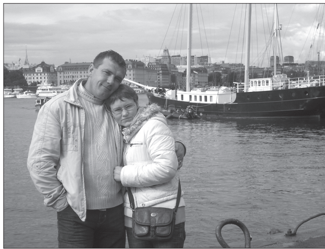
Ar sievu Daigu ceļojumā Zviedrijā.

Tāpēc jau man celtniecība patīk, ka es vēl pēc gadiem redzu sava darba augļus. Zinu katra objekta labās, stiprās vietas un arī ne tik labās. Tās ir paliekošas vērtības. Varbūt kādreiz esmu arī kļūdiņies, to jau tikai vēlāk saproti. Visiem objektiem esmu līdzī dzīvojis – vai tas ir mazāks vai lielāks, visos esmu pavadījis kādu laiku periodu, ieguldījis darbu un labas domas. Visi objekti ir vienlīdz nozīmīgi – vai tas ir liels vai mazs. Arī pensionāra pasūtījums par savu sakrāto naudiņu ir nozīmīgs objekts. Visi objekti jāceļ vienlīdz kvalitatīvi un tad arī vari cerēt, ka klients būs apmierināts un ieteiks tevi arī kaimiņam. Strādājām jau ilgi pirms savas firmas nodibināšanas un vēl tagad cilvēki par mums spriež pēc mūsu padarītajiem darbiem. Tagad pārsvarā startējam konkursos, saņemam valsts objektus. Tie arī ir stabilākie, jo valsts pasūtījums ir ar garantiju, līgums ir noslēgts. Bet konkursā vinnētais objekts gan ne vienmēr nozīmē to, ka tas ir labs objekts, jo vinnē jau ar zemāko cenu un tas nav vienkārši. Vienmēr jau varam gribēt la-