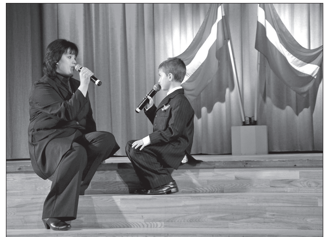
Iedegsimies par Latviju. Mācīsim milēt zemi, kurā dzīvojam, sev un saviem bērniem. Lai katram no mums izdodas paturēt savā sirdī mīlestību uz savu valsti ne tikai novembrī, bet visa gada garumā!

Paldies visiem koncerta dalībniekiem un skolotājiem, kuri palīdzēja šos svētkus radīt. Paldies kultūras centram.