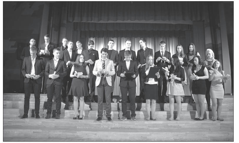
12. klašu skolēni divpadsmito vakarā „Skarbā patiesība”.

„Jau no janvāra beigām abas 12. klases cītīgi sāka gatavoties uzvedumam, kurā vēlējas parādīt, ko tad spējam pašiem divpadsmitie. Pirmais kopējais mēģinājums tika veltīts uzveduma tēmai. Beigu beigās skolēnu izvirzītais nosaukums bija „Skarbā patiesība”. Uzvedums tika gatavots kā stāsts par to, kā ir paskrējuši šie 12 gadi skolā, vai tie bija skarbi, vai arī tomēr patīkami, jautri, patiesi. Tika izveidots scenārijs un tad maziem soliņiem viss apgūts un iestudēts. Nekļūdišos, ja teikšu, ka gala rezultātā tika veltītas vismaz 30 stundas, lai viss izskatītos tieši tā, kā tas bija paredzēts. Tika iestudētas