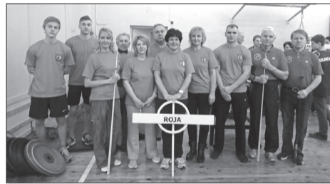
Rojas novada komanda pirms atklāšanas parādes.

7. jūnijā notiks vasaras posma sacensības Valdemārpilī maksšķerēšanā, sporta spēlēs, vieglatlētikā, veiklības stafetē, ģimeņu stafetē, spēlē „Petanks” un spēka stafetē. Ceru uz atbalstu