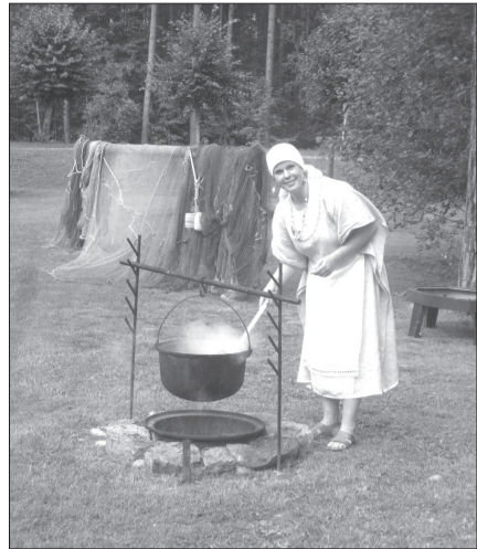
Top gardā, tik daudziem zināmā zivju zupa.