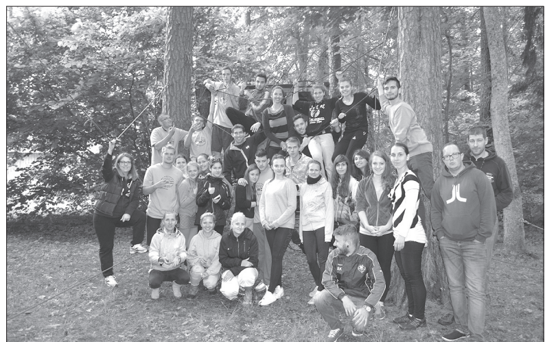
Projekta laikā jaunieši ne tikai sadraudzējās, bet apguva arī tā saukto neformālo izglītību – māku savstarpēji komunicēt, brīvi runāt svešvalodā un pieņemt citas tautas kultūru.

Grieķu jaunieši no šejienes aizbrauca ļoti apmierināti un apņēmības pilni rakstīt projektu, lai varētu uzaicināt ciemos savus jauniegūtos draugus. Viņu iespaids par Latviju – ļoti zaļa zeme ar gariem kokiem un slaidiem cilvēkiem. Nometnes pēdējā dienā izpildījām grieķu jauniešu vēlēšanos – 3 stundu garumā iepazīstinājām viņus ar mūsu galvaspilsētu Rīgu. Un tad jau bija klāt arī atvaidīšanās brīdis ar bučām un asarām. ■