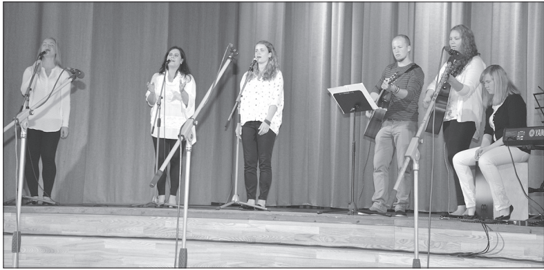
Uzstājas „Priekā Vēsts” jaunieši.