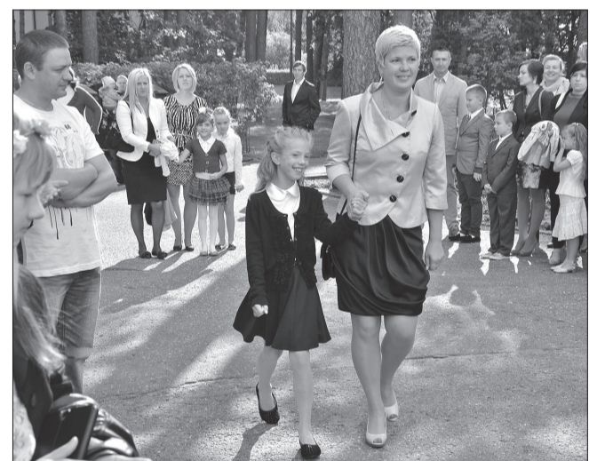
Pirmajā skolas dienā visdrošāk tomēr ir mammai pie rokas.

Iepriekšējais mācību gads tika noslēgts, kārtējot centralizētos eksāmenus 12. klasēs, kuru rezultāti ir viens no vērtējumiem paveiktajam darbam mācību jomā.