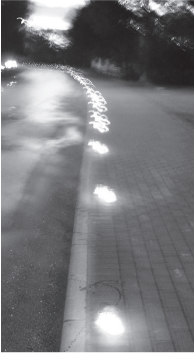
Svecīšu izgaismotā Selgas iela ikvienam autobraucējam lika samazināt ātrumu, bet no savām mājām ar degošām svecītēm rokās iznāca teju vai katrs Selgas ielas iedzīvotājs.