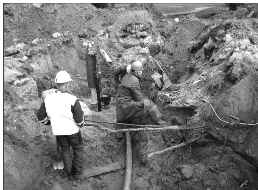
Būvdarbi Rudē norit saskaņā ar grafiku un tiks pabeigti savlaicīgi.

PROJEKTU „ŪDENSŠAIMNIECĪBAS ATTĪSTĪBA ROJAS NOVADA ROJAS PAGASTA RUDES CIEMĀ II KĀRTĀ” LĪDZFINANSĒ EIROPAS SAVIENĪBA FINANSĒJUMA SAŅĒMĒJS ŠĪ PROJEKTA IETVAROS IR SIA „ROJAS DZKU” PROJEKTA ADMINISTRATĪVĀS, FINANŠU UN TEHNISKĀS VADĪBAS UZRAUDZĪBU NODROŠINA CENTRĀLĀ FINANŠU UN LĪGUMU AĢENTŪRA