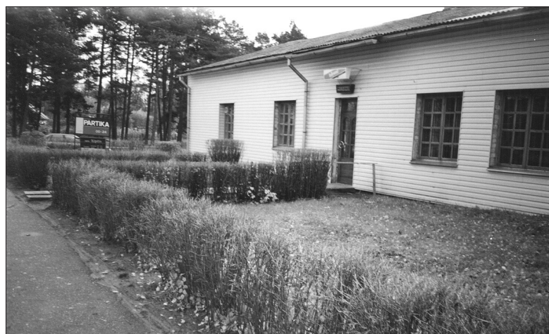
Pirts ēka jau pārgājusi SIA „Ķipītis” īpašumā.