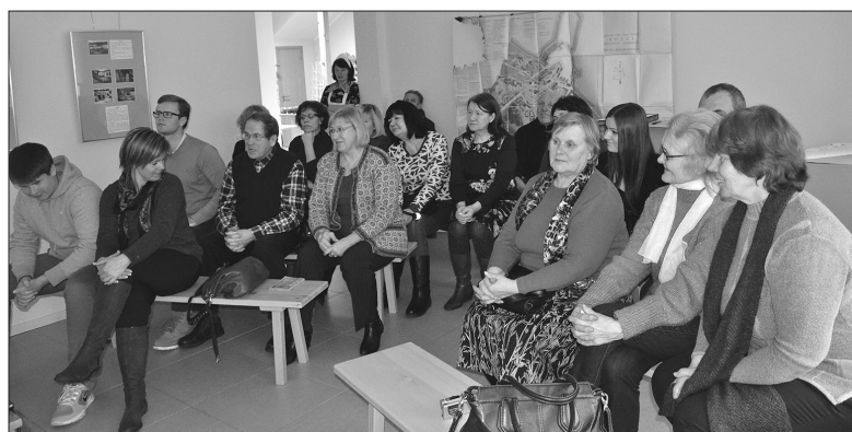
Muzeja pasākumi pulcē arvien vairāk interesentu.