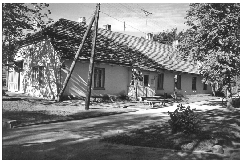
Jaunā DzKU ēka.