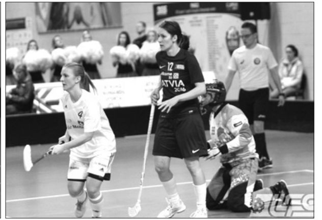
Zane cīnā pret Šveices izlasi, kas bija turnīra spēcīgākā komanda.