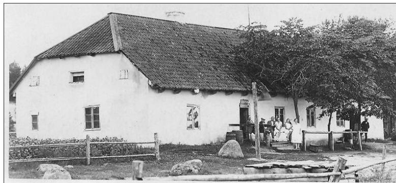
Vecā stacijas ēka, kuru rotā uzraksts ROJA.