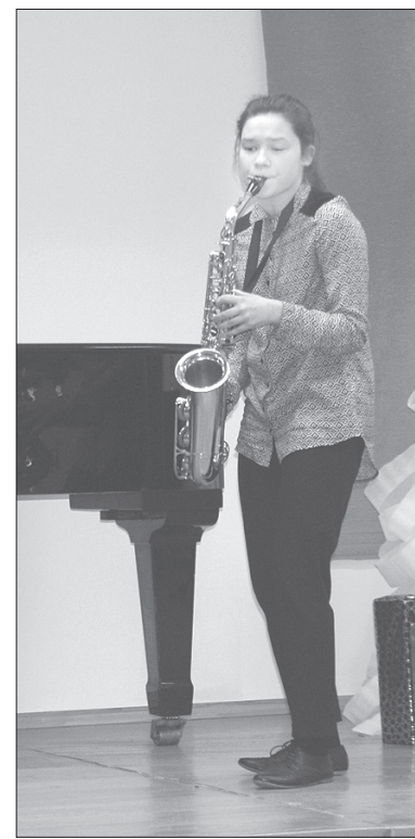
Beate allaž ir gatava jauniem izaicinājumiem.

Rojas Mūzikas un mākslas skolas direktors