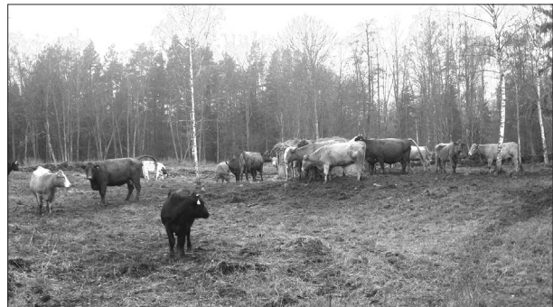
Lai cik arī augstvērtīga būtu barība, ar ko piebarot lopus, mitro un sulīgo zāli tā aizstāt nespēj.

Viskarstākais darba laiks jau ir vasarā, kad jāgataavo siens. Nedrīkst nokavēt īsto laiku un, nedod Dievs, ja sāk lit. Sienu vajag daudz un labi, ja to var sagatavot vairāk, lai paliek pāri, nevis pietrukst. Pagājušajā ziemā mums lielu skādi nodarīja brieži – saplēsa ruļļiem plēvi un tas sāka pūt. Lielus postījumus nodara arī mežacūkas. Pagājušajā ziemā saskaitīju 33 briežus – viņi nāk uz mūsu siena šķūni. Kaimiņš teica, ka viendien aizgājis medīt un domājis, ka mums izmukušas govīs – visas barā nākušas uz lauka. Sācis skaitīt, un, kad tās pienākušas tuvāk, sapratis, ka tās nav vis govīs, bet brieži. Saskaņotais bija līdz 40, tad skaits sajucis. Nav zināms, kas tas bijis par briežu saietu. Tie dzīvnieki ir gudri – novaktē, kad apkārt viss ir kluss un mierīgs un tad nāk uz kūti. Divās bargajās ziemās jau mēs stīri cietām. Ir bijis gadījums, kad ejam pakal govīm uz ganībām un blakus govīm guļ briedis. Vienreiz arī lapsa bija apgūlusies līdz ar govi, no tāienes nevarējām saprast, domājām, ka teļš piedzimis. ■