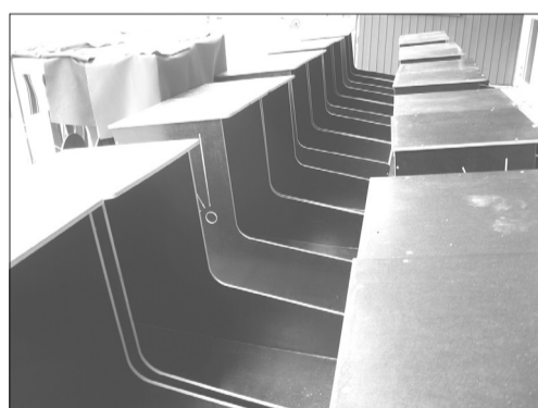
Šajās kastēs dienu dienu guļ bērni Zviedrijā.

Lieldienu brīvdienās, viesojoties Zviedrijas pilsētā Oskarshamnā, izmantoju iespēju paviesoties vienā no pilsētas bērnu dārzkiem. Zināju, ka bērnu dārzs ir uzcelts pavisam nesen un skaitās viens no modernākajiem valstī. Zināju arī to, ka bērni tajā dienu dienu guļ tikai laukā, speciāli veidotās kastītēs. Tajās ziemas dienās, kad Latvijā sals knieba degunā ne pa jokam, vienmēr raizējos par to, kā šie mazuļi jūtas savās kastītēs. Nu beidzot redzēju šo brīnumu savām acīm. Pie bērnu dārza zem nojumes rindoja koka kastes. Katram bērnam sava kaste ar bērna vārdu. Kad tuvojas dienas beigās, bērni tiek speciāli apģērbti – vīrs jau esošā bērna apģērba tiek uzvilks speciāls, no filca gatavots tērps, tad seko cepure, cimdi, vilnas zeķītes. Šādi saģērbti bērni katrs ņem savu matracīti, kas tiek turēti telpās, lai vienmēr būtu silti, un dodas uz savām kastītēm, kur vēl papildus katrs bērns tiek ieguldīts guļammaisā.