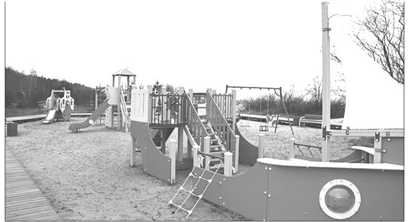
Jaunais rotaļu laukums Rojas pludmalē.

Rojas novada domes sabiedrisko attiecību speciāliste