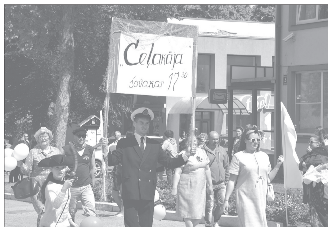
Asprātīgi, kā reklamēt savu vakara izrādi, bija izdomājuši Rojas teātra kopa.