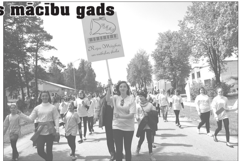
Rojas Mūzikas un mākslas skolas audzēkņi svētku gājienā Rojas dienās .

Mākslas skolā tiek gaidīti arī cilvēki, kas nav vairs skolēnu vecumā. Visi, kas ieinteresēti mākslas jomā, var apgūt