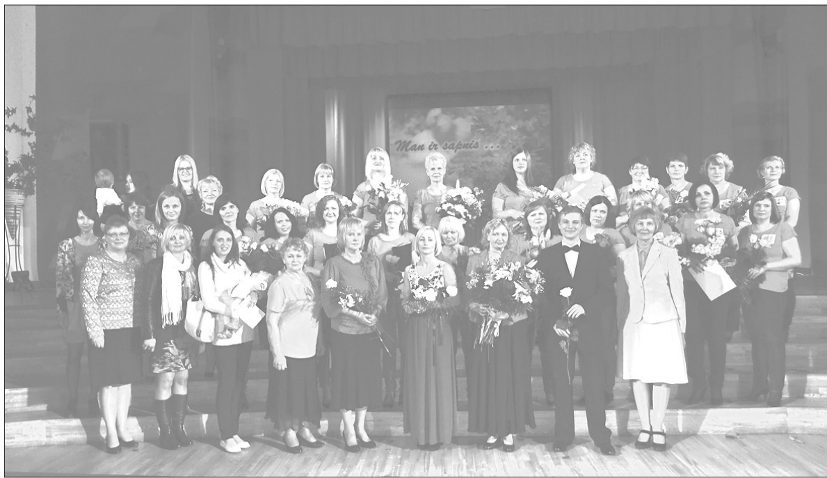
Atkal visas kopā uz vienas skatuves – bijušās un esošās dziedātājas.