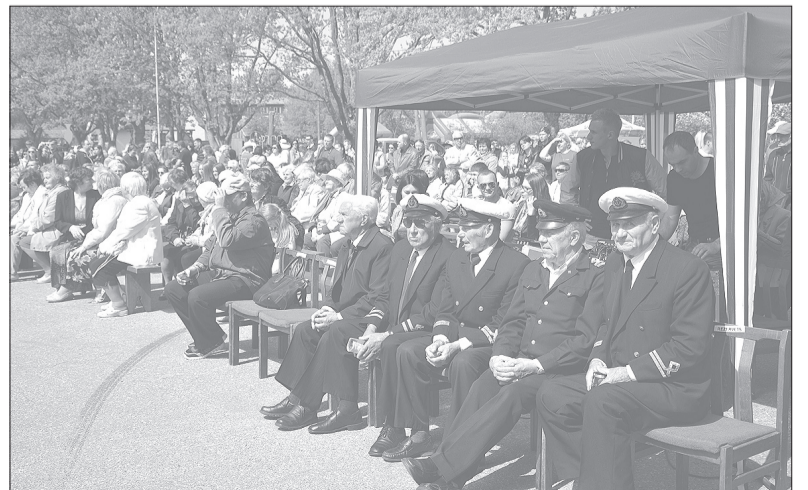
Kā katru gadu, godāti tiek vecie Rojas zvejas vīri. Žēl tikai, ka viņu ar katru gadu paliek arvien mazāk.