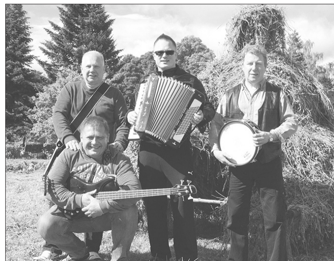
Grupas „Roja” jaunais sastāvs.

Turēsim īkškus, lai grupa „Roja” no Jelgavas atgriežas ar galveno balvu, kas būšot grandioza, bet pagaidām tiek turēta lielā noslēpumā! ■