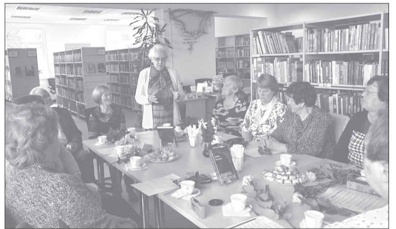
Jaunās grāmatas atvēršana vienmēr ir svētki gan pašai rakstniecei (centrā), gan viņas līdzcilvēkiem.