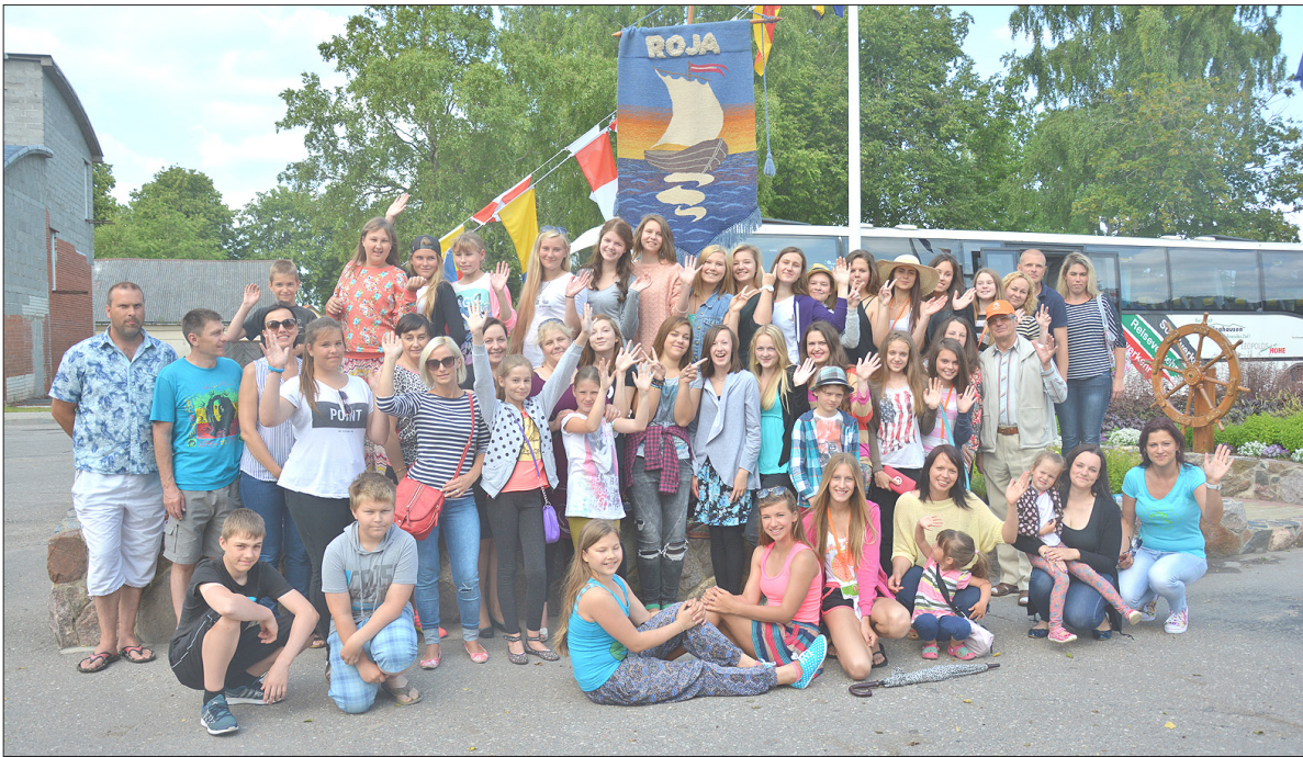
Koris „Roja” pirms izbraukšanas uz lielo notikumu. Vairumam no bērniem šie būs viņu pirmie Dziesmu svētki.