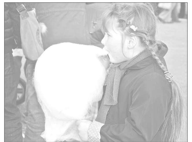
Katram tirgus apmeklētājam savs kārumš.