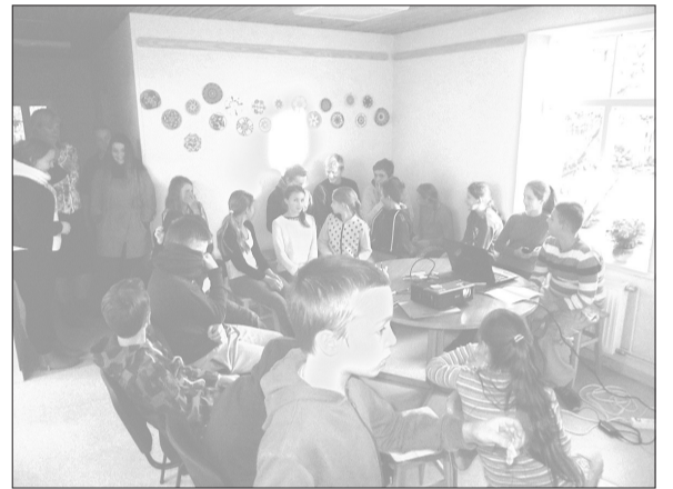
Bērni vēlas, lai arī turpmākajos gados veiktos tikpat labi, kā līdz šim.

Visi pasākuma dalībnieki tika aicināti kopīga uzveduma veidošanā. Kāds centās atdarināt vēju, kāds – lietu, sunīti, mēnesi, zirgu, princī vai princesīti. Protams, neizpalika arī tradicionālās aktivitātes – spēles un atrakcijas, piemēram, „Leišu kājiņas”, dejas ar baloniem, foto stūrītis, kā arī novē-