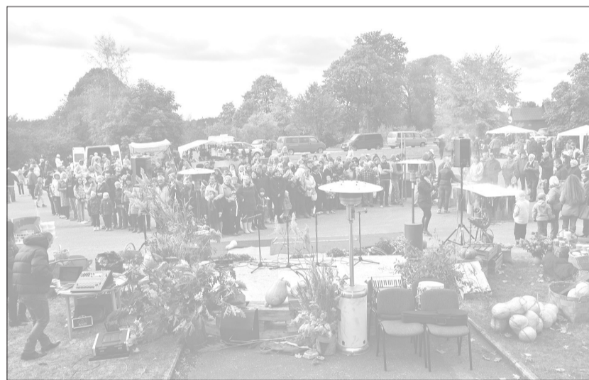
Tirgus apmeklētāji izveidoja simbolisku sirdi, kuras vidū tika ienesta milzīgā olu plāts.