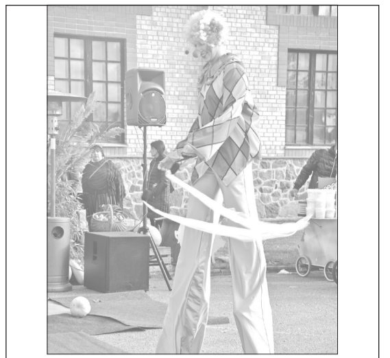
Klauna ierašanās priecēja gan mazos, gan lielos tirgus apmeklētājus.