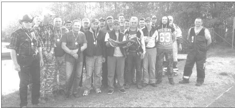
Vīru skaits, kuri grib dienu pavadīt labā kompānijā svaigā gaisā, ar katru gadu pieaug.