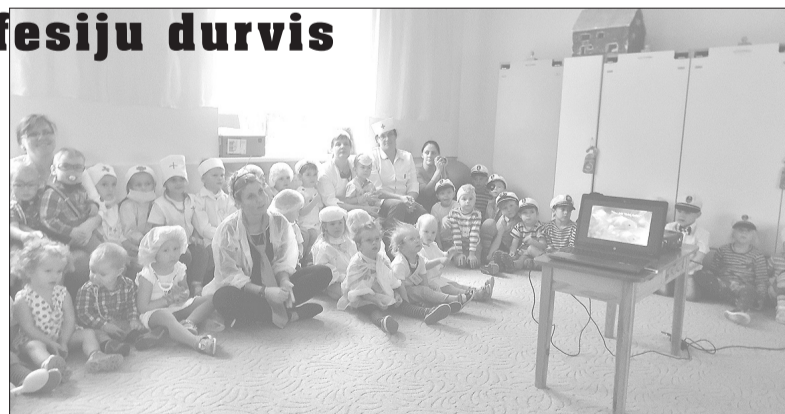
Profesijas smalkumus apgūst nākamie dakteri.

Ceturtdien ciemojāmies pie galdniekiem, bet