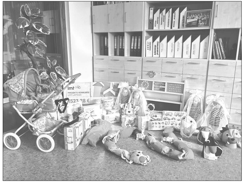
Jaunās rotaļlietas, kuras tā vien gaida, kad bērni ar tām spēlēsies!

Jau kopš 2011. gada „Latvijas Mobilais Telefons” sadarbībā ar Latvijas pašvaldībām pilsētu iedzīvotājiem un iedzīvotāju grupām, kuri vēlas ar idejām un projektiem piedalīties savas pilsētas attīstībā, piedāvā iespēju piedalīties projektu konkursā „LMT Latvijai”. Projekta mērķis ir veicināt sabiedrisko dzīvi Latvijas pilsētās un atbalstīt privātpersonu, juridisku personu un nevalstisko organizāciju iniciatīvas pilsētu sabiedriskās dzīves izaugsmei. Šogad projektu konkursā piedalās Cēsis, Madona, Dobeles, Roja, Skrunda, Iecava