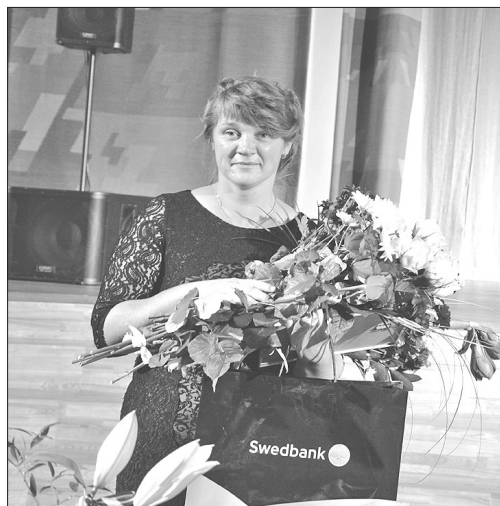
Līgai Reinei A/S „Swedbank” apbalvojums bija milzīgs pārsteigums!