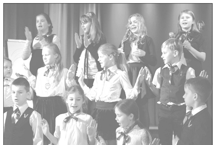
2.–4. klašu koris ar priekšnesumu pasākumā „Gaismas vara lielu dara”