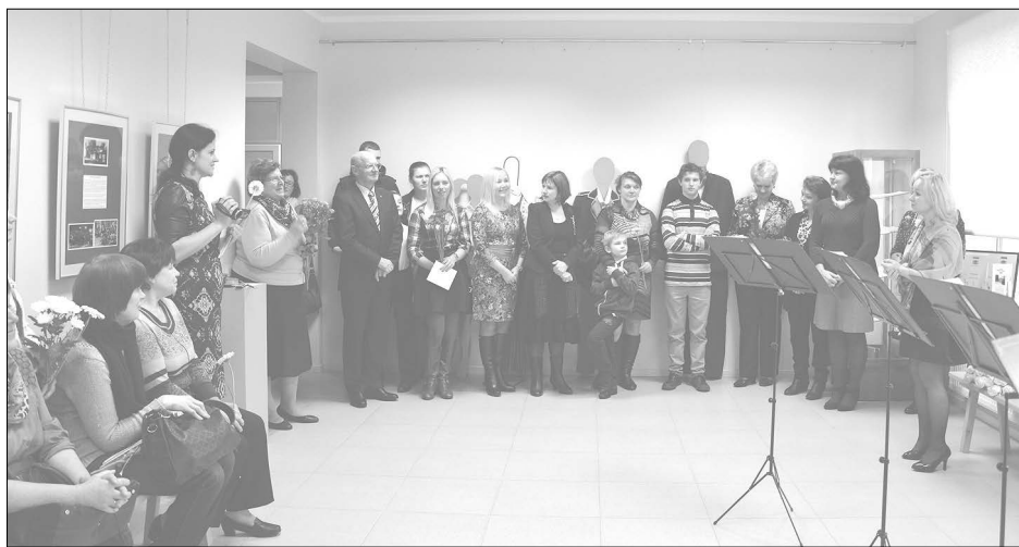
Izstādes atklāšanā piedalījās gan bijušie, gan esošie skolēni un pedagogi.

Šobrīd apskatāmi gan tautas tērpi, gan mākslas skolas audzēkņu dažādie darbiņi, kā arī kasešu un lenšu magnetofoni, tādējādi parādot, kā agrāk tika sagatavoti ieraksti mūzikas skolas eksāmeniem. Šobrīd tehnoloģiskās iespējas ir strauji attīstījušās un materiāli tiek saglabāti kompaktdiskos un elektroniski.