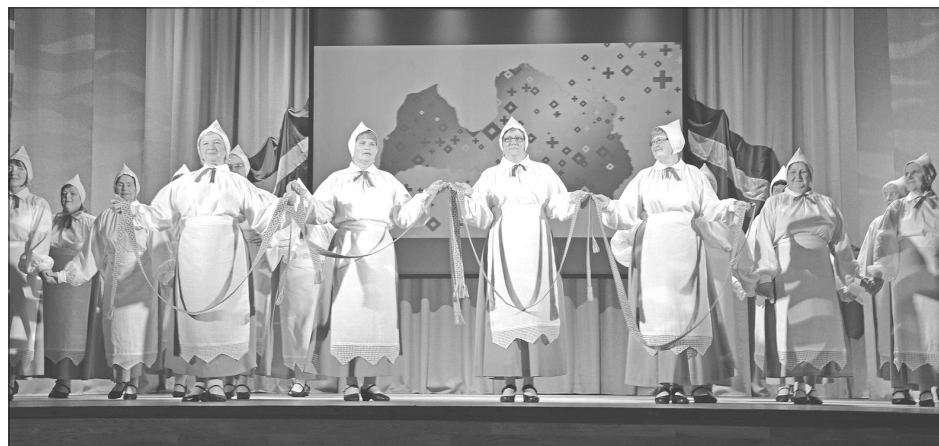
Ar priekšnesumu uzstājas deju kopa „Gaspaziņa”.