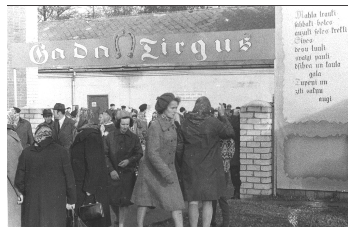
Gadatirgus Patērētāju biedrības pagalmā bija plaši apmeklēts.