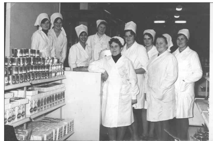
Veikala „Kaija” kolektīvs 1972. gadā.

Šajā vakarā tika pieminēta arī Rojas vecā ēdnīca upītes malā, kurā tirgota bezgala garšīga šokolāde, ēdnīca virs tagadējā veikala „Maxi-