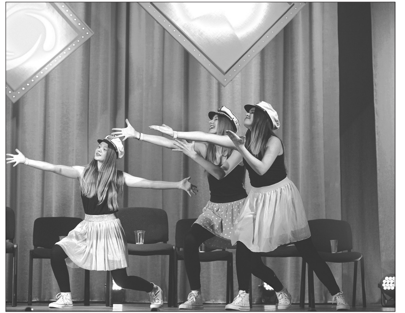
Šīs meitenes ieguva skatītāju simpātiju balvu.