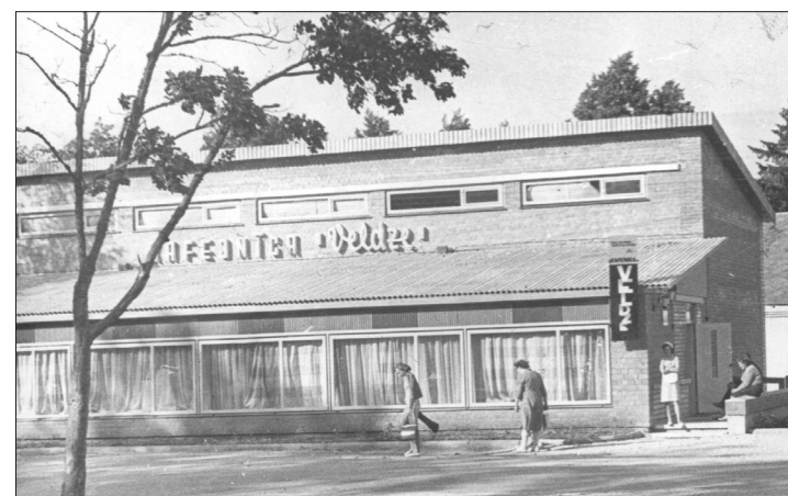
Tikko atvērta „Veldze” ātri kļuva populāra.