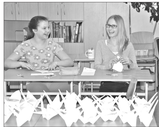
Projektu dienās tika salocīti simtiem origami, ar ko dekorēt telpas skolas jubilejā.

Lasiet 3. lpp. rakstā „Projektu dienas un mācību olimpiādes skolā”