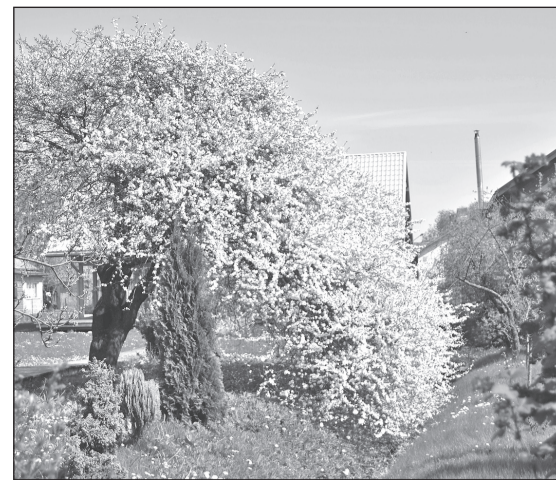
Pavasaris – skaistākais gadalaiks, kad viss plaukst, zied, smaržo un šķiet, ka dzīve ieguvusi jaunu elpu.