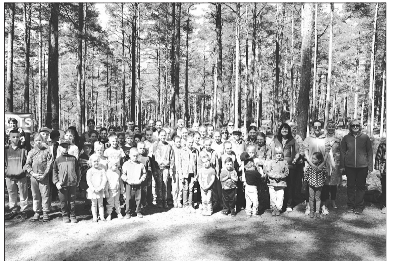
Šeit salasījušies visi tie, kuriem rūp gan sava garīgā, gan fiziskā veselība.