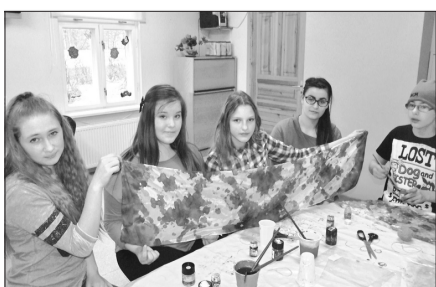
Darba process radošajā darbnīcā. Albuma foto

2016. gada 15. aprīlī Rojas novada dome noslēdza līgumu Nr. 4-27/9 ar Jaunatnes starptautisko programmu aģentūru par projekta „Mācies