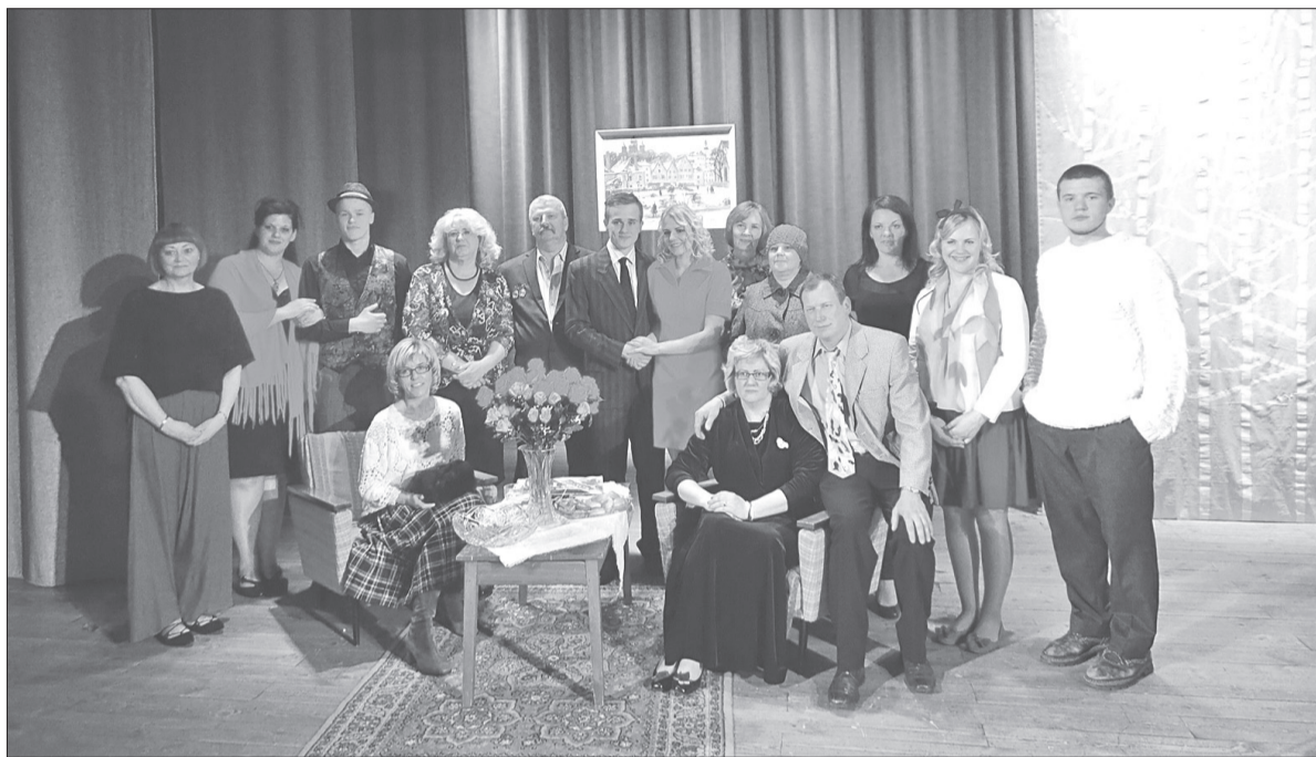
Ikviena no šiem lieliskajiem aktieriem būtu pelnījis labākā aktiera goda nosaukumu.