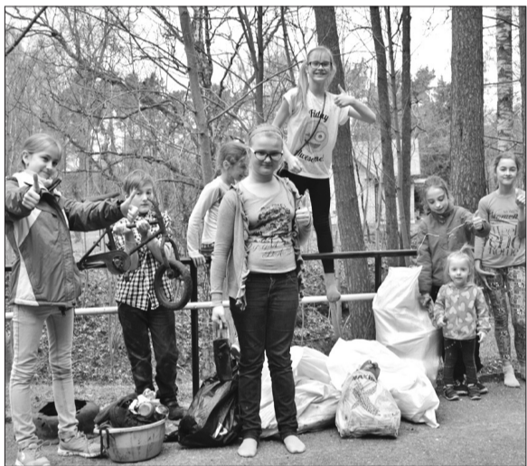
Čaklie talcinieki ar saviem atradumiem.