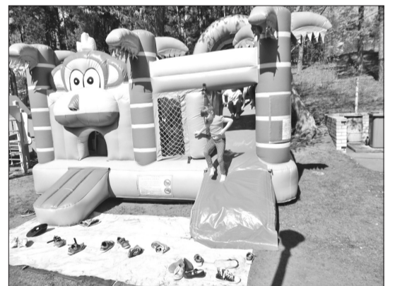
Bērni ar ovācijām pauda savu prieku, ieraugot pagalmā piepūšamo māju. Albuma foto

tātēs pavadīja rīta cēliņu – sportojot, lidinot lidmašīnas, peldinot paštairisot kuģus, griežoties karuselī. Un kur nu vēl vecāku sagatavotie kārumi piknikam! Atgriežoties bērnu dārzā, jau iztālēm bija pamanāms lielais pārsteigums – koša, milzīga piepūšamā māja. Visi ar skaļiem priekšrocieniem steidzāmies tur, kur mūs jau gaidīja Asnātes tētis un mamma, kuri bija sagādājuši šo pārsteigumu. Bet vēl lielākas ovācijas sākās, kad sētā ieraudzījām vēl otru piepūšamo māju un trīs kartingus. Tā nu bērni izmēģināja savu veiklību, šļūcot no slidkalniņa, lēkājot un pārvarot šķēršļu barjeras, kā arī iemēģinot prasmes braukšanā ar kartingu. Šos lielos priekus bija iespējams baudīt visiem „Zelta zivtiņas” bērniem. Vislielākais paldies no Asnātes grupiņas draugiem un visiem bērnu dārza bērniem par šo prieka pārpilno dienu.