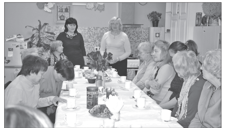
Noslēdzošajā nodarbībā visi pulcējās pie balti klāta galda.