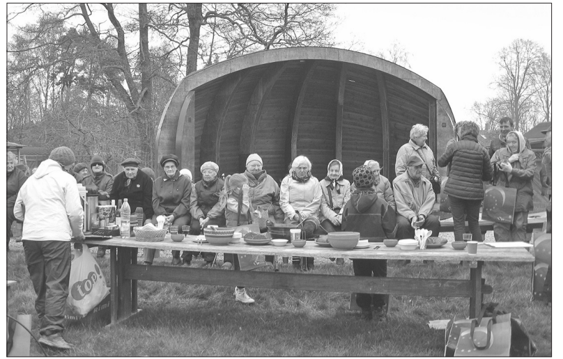
Rojas invalīdu biedrības ļaudis allaž bijuši visčaklākie talkas atbalstītāji.

Un tad jau klāt arī pusdienlaiks, kad Rojas muzeja sētā pēc krietnas pastrādāšanas uz laša zupu pulcējās Rojas novada invalīdu biedrības ļaudis, kuri jau kuro gadu talko kopā ar Eiropas Parlamenta deputāti Inesi Vaideri. Nekas neliecināja, ka šie cilvēki, vākdami atkritumus jūrmalā, nostaigājuši krietnu