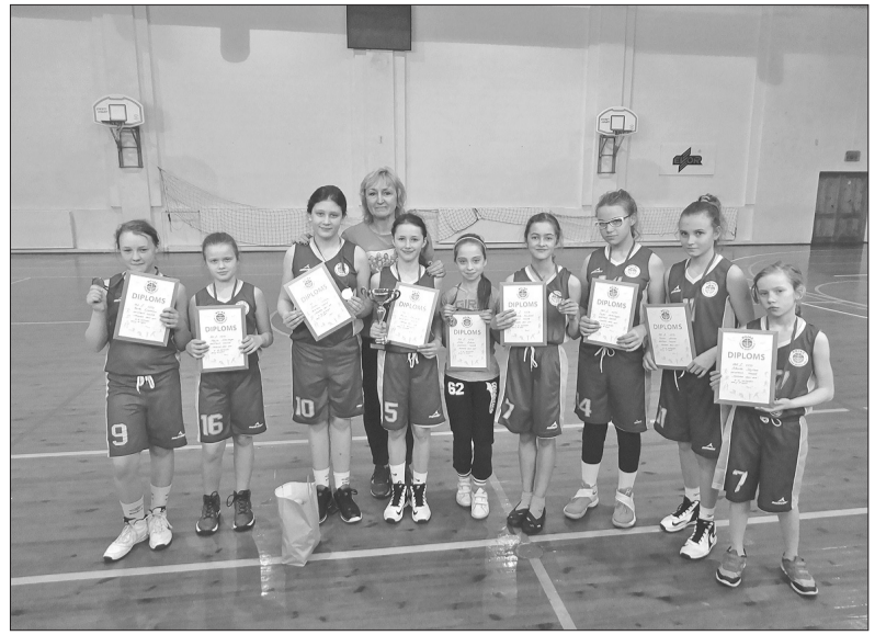
Komanda pēc apbalvošanas.

Vasarā, augustā meitenēm tiek plānotas divas sporta nometnes – viena Vaidē pie jūras, bet otra kopā ar Talsu