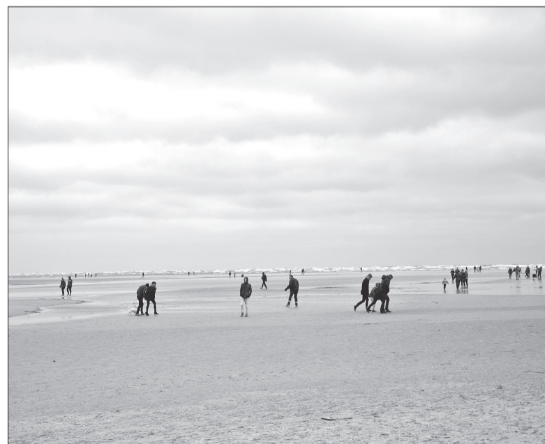
Tālumā esošie cilvēki izskatījās kā mazas skudriņas – tik tālu varēja jūrā pastaigāties.

ir izzudusi dzīvība – tā domā zviedru zinātnieki.