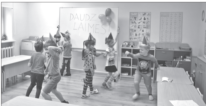
Dejojot un rotaļājoties tiek atzīmēta grupiņas biedrenes dzimšanas diena.

nus, kuri vienmēr vēlas apgūt ko jaunu! Marīta Pāvuliņa, sabiedrisko attiecību speciāliste