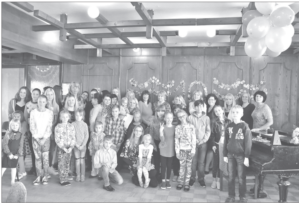
Svētku dienā tapa arī kopīgs foto.

Pirmo reizi „Varavīksne” savas durvis vērā 2006. gada 13. oktobrī. Šobrīd bērniem ir iespēja jauniešu centrā izmantot bezmaksas internetu, saņemt atbalstu mācībās, spēlēt dažādas galda spēles: tenisu, novusu, futbolu, hokeju u.c., apgūt dažādas rokdarbu tehnikas: pārlošanu, enkaustiku, marmorēšanu, dekupāžu u.c., darboties stikla un zīda apgleznošanas darbnīcās, apgūt iemaņas pasākumu organizēšanā un vadiša-