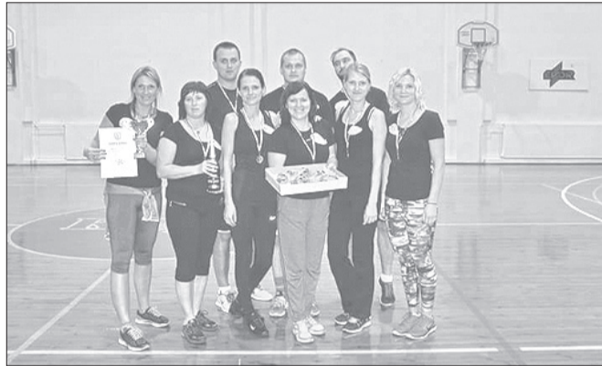
1. vietas ieguvēja komanda „Zelta zivtiņa” pēc apbalvošanas.

1. vietu un kausu kopvērtējumā pārliecinoši izcīnīja PII „Zelta zivtiņa” komanda, 2. vieta „Strīpainajai domei”, bet 3. vietā – Rojas vidusskolas komanda, kura tikai par vienu punktu apsteidza 4. vietas ieguvēju – Rojas MMS un sporta skolas apvienoto komandu. Atraktīvā komanda „Kulturālie” visiem ļāva uzvarēt un paši palika 5. vietā! Kopvērtējuma tabulu var apskatīt Rojas mājas lapas sadaļā SPORTS.