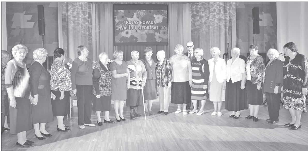
Īpaši sumināti tika tie biedrības ļaudis, kuri aktīvi darbojās jau no biedrības dibināšanas brīža.

Daudz laimes, Latvija! Dievs, svētī Latviju! Zemī, cilvēkus, valodu, Dziesmu un ticību, Godaprātu un darba tikumu; uzturi mūs dzīvus, Dari mūs brīvus – Garā un pateicībā, Cilvēka vārda cienīgus Latviešus Tēvzemē un pasaulē. (Velta Toma)