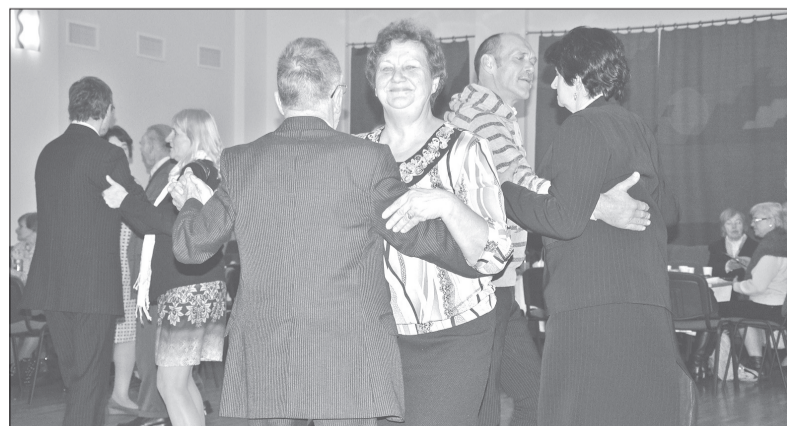
Kārtīga izdejošanās ir neatņemama svinību sastāvdaļa.