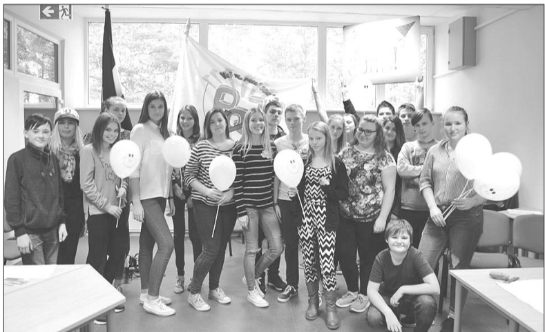
Jau otro reizi konkursā uzvarēja 8. klase.

„Karjeras nedēļas 2016” ietvaros Rojas vidusskolā 21. oktobrī noslēdzās konkurss „Vai tu mīli jūru?”. Lai aktualizētu skolēnu vidū profesijas, kas saistītas ar jūrniecību, un veicinātu paaudžu sadarbību kultūrvēsturiskā mantojuma saglabāšanā, konkursā sacentās 11 komandas no 5. līdz 12. klasei.