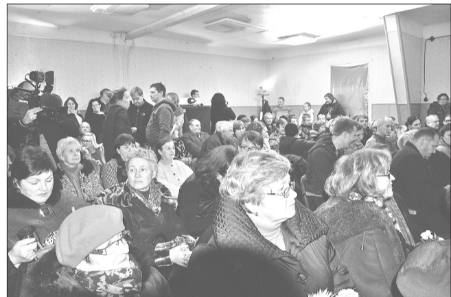
Pēc daudzu gadu pārtraukuma vecā kluba ēka piedzīvoja nepieredzētu ļaužu pieplūdumu.