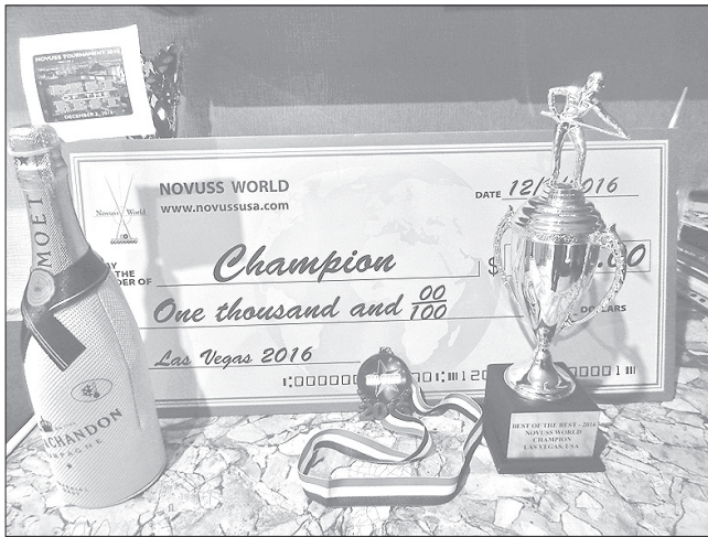
Ar šīm balvām Imants atgriezās no sacensībām Lasvegasā. Albuma foto