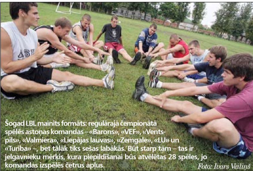
Šogad LBL mainīts formāts: regulārajā čempionātā spēlēs astone komandas – «Barons», «VEF», «Ventspils», «Valmierā», «Liepājas Lauvas», «Zemgale», «LU» un «Turība» – bet tālāk tiks sešas labākās. Būt starp tām – tas ir jelgavnieku mērķis, kura piepildīšanai būs atvēlētas 28 spēles, jo komandas izspēlēs četrus apļus.