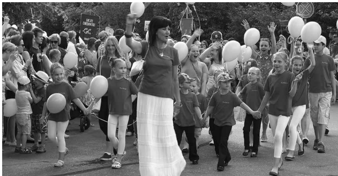
Lielākā daļa no aptaujātajiem salaspiliešiem labprāt apmeklē Novada svētkus. Šogad viens no spilgtākajiem pasākumiem bija gājieni, kurā piedalījās mūsu iestādes un biedrības.

Viens no būtiskākajiem kultūras pieredzi noteicošajiem faktoriem ir komunikācija ar iedzīvotājiem par kultūras jomu. Tas attiecas gan uz lēmumu pieņemšanu par kultūras dzīves organizēšanu, gan uz iespējām pašiem apmeklēt pasākumus vai iesaistīties kādā kolektīvā. "Ir tāda sajūta, ka informēt vajadzētu vairāk. Man nav tā pareizā atbilde – kā, bet ir tā sajūta, ka tā vispār ir 21. gadsimta slimība, kā izlauzties cauri tai milzīgajai informācijas