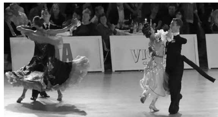
Varam būt lepni, ka pie mums notiek tik izcilis pasākums kā "Salaspils novada kauss", kas pulcē kopā labākos valsts deju grupas.

Citātos saglabāts respondentu rakstības stils un pieturzīmju lietojums.