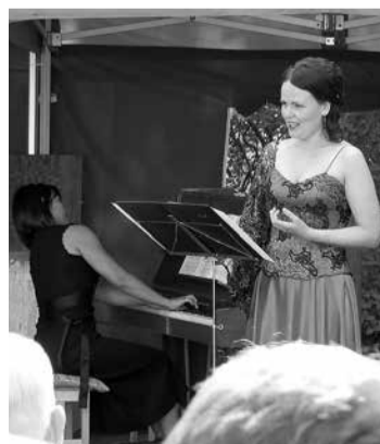
Pavisam nesen krāšņi izskanēja kamerģitāras koncerts Doles salā.