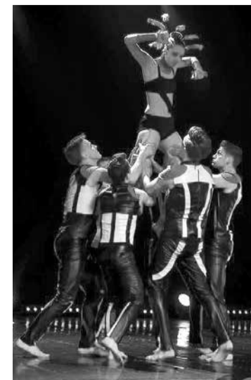
Respondenti uzskata, ka Salaspils patiesi var lepoties ar mūsu deju studiju "Buras".

• Piedāvājums ir kvantitatīvi apjomīgs, bet ar tradicionālo pasākumu dominanti un bez izteiktas unikalitātes. Pasākumu skaita audzēšana bez jaunas auditorijas piesaistes aktivitātēm var radīt auditorijas apjoma samazināšanos vienam pasākumam, jo vieni un tie paši cilvēki ne vienmēr spēj apmeklēt lielu pasākumu skaitu. • Kultūras piedāvājuma daudzveidību (piem., kvalitatīva muzikāla