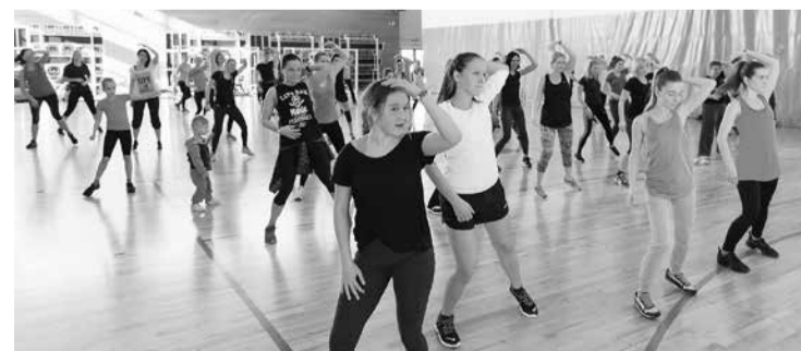
Aptaujātie salaspilieši atzīst, ka novadā liela nozīme ir sportam. "Fitnessa deserts" ir viens no apmeklētākajiem sporta pasākumiem, kas notiek hallē.