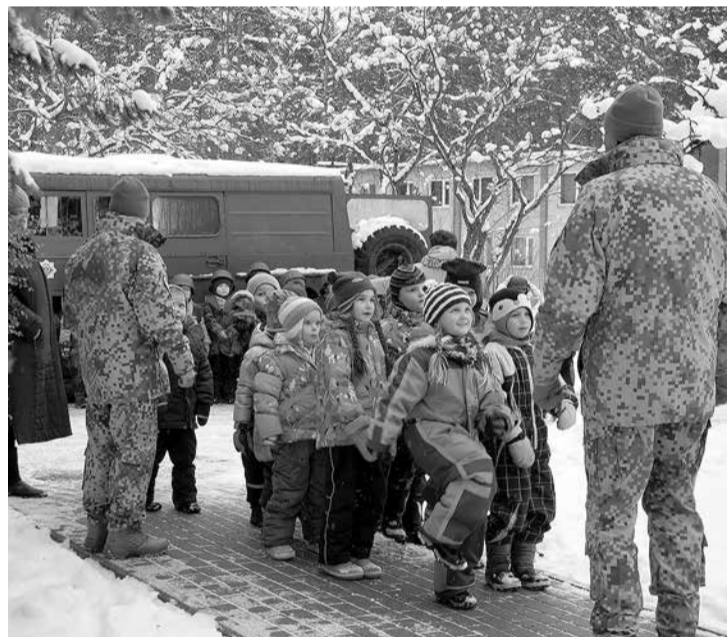
Zemessargu vadībā bērni apgūst ierindas soli.

Iededziet svečīti logā, Iededziet Latvijai to, Liesmiņa mazā un skaistā, Lai silda un pasargā to.