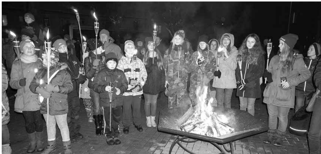
Kā ik gadus, salaspilieši vienojās lāpu gājienā, godinot Brīvības cīņās kritušos karavīrus.

Reizē ar militāriem draugiem mūs apdraud arī sabiedrības sašķeltība. Sašķeltība ekonomiskajā nevienlīdzībā un diemžēl dažreiz arī sašķeltība etniskajā ziņā. Latvijas valsts pieder mums visiem, un man ir patīss prieks par daudziem krieviem, ukraiņiem, poļiem un citu nāciju pārstāvjiem, kuri šodien ir kopā ar mums. Mani pārņem lepnums par tiem, kuriem latviešu valoda nav dzimtā, bet kuri dienē mūsu militārajos spēkos.