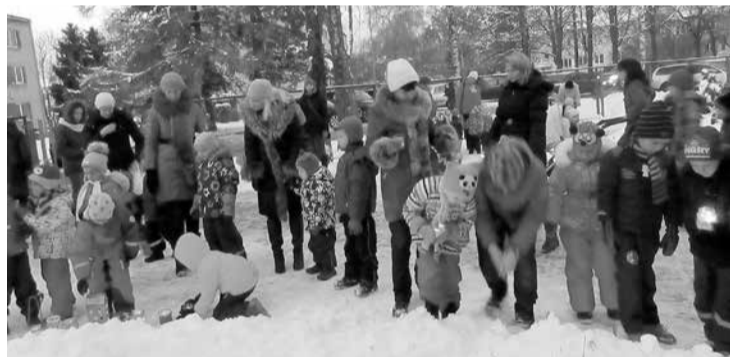
Lāčplēša dienā „Saimes” bērni devās uz Zemessardzes 19. nodrošinājuma bataljonu.

Tās pašas dienas vakarā, kad saule sāka rietēt, PII „SAIME” bērni kopā ar vecākiem pulcējās pie bērnu dārza galvenās ieejas, lai aizdeg-