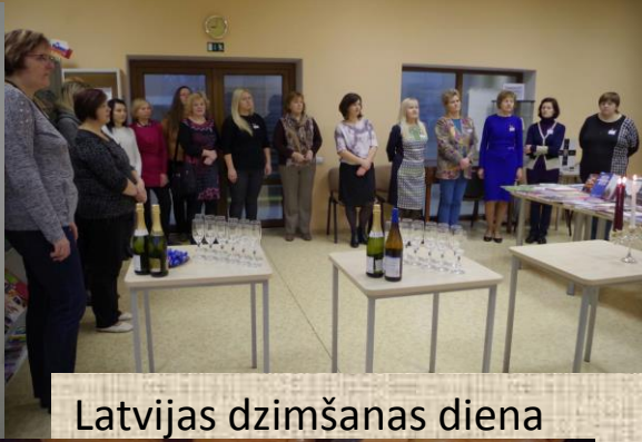
Latvijas dzimšanas diena