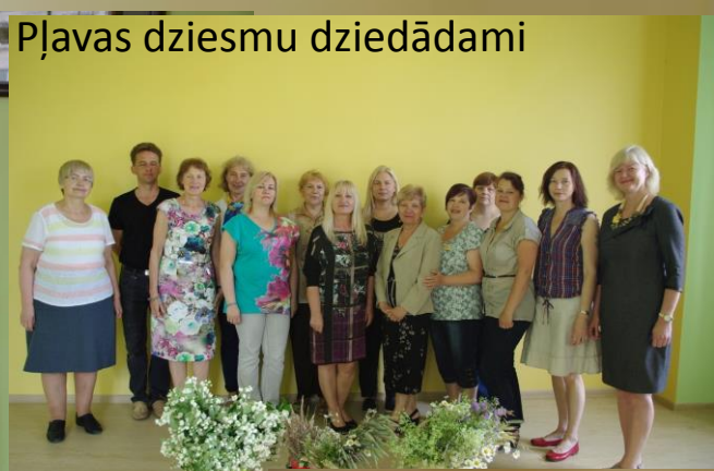
Pļavas dziesmu dziedādami