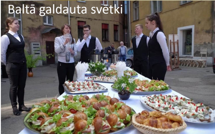
Baltā galdauta svētki

Mēs - pilsētas mēroga pasākumos – 1.septembra Ziņībumā; Metāla svētkos; Piena, Maizes un Medus svētkos; Muzeju naktī, Baltā galdauta svētkos, Dzejas dienā; Tradīcija – ģimenes dienas