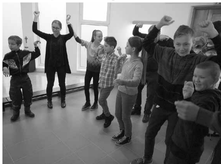
“Zīļuka” bērni pavādīja jauniem iespaidiem bagātu un jautru dienu Salaspilī.

Noteikti šī diena bija arī kā dāvana mums pašiem – draudzes cilvēkiem. Tā vairoja apziņu, ka kopā