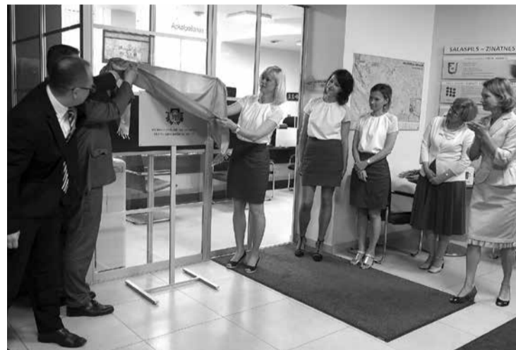
Pēc Salaspilī durvis vēra Valsts un pašvaldības vienotais klientu apkalpošanas centrs.

Kopējie izdevumi 2017. gadā tiek plānoti 33 311 974 eiro apmērā. No tiem 29% jeb 9 804 849 eiro paredzēti investīcijām vai tautsaimniecības finansējumam.