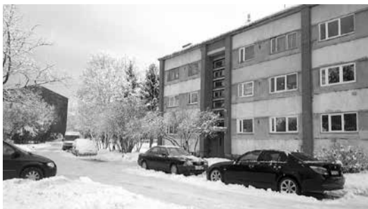
Pirms projekta realizācijas.

Iedzīvotāju atsaucība mūsu mājā ir liela. Mājas renovāciju atbalsta