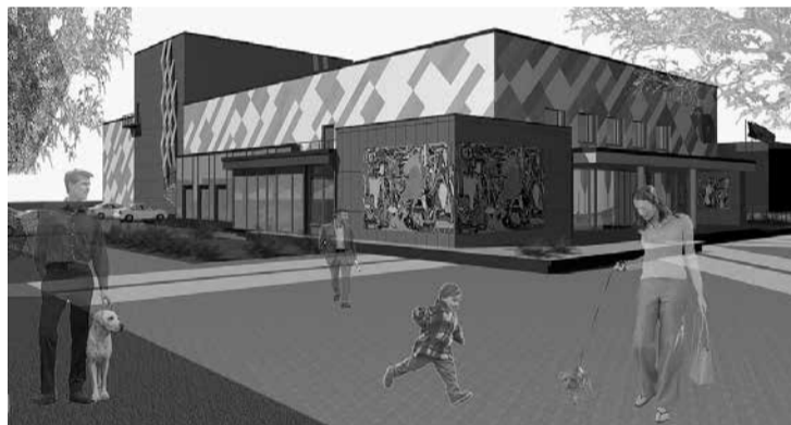
Šogad plānots uzsākt k/n “Enerģētisks” pilnīgu rekonstrukciju, lai Latvijas simtgadi mēs sagaidītu jaunā un modernā ēkā.

Izdevumu pārsniegums pār ieņēmumiem tiks segts no budžeta līdzekļu atlikuma uz 2017. gada 1. janvāri un piesaistītajiem kredītiem. Pamatbudžeta atlikuma sadalījums kredītiestāžu kontos un speciālā budžeta atlikuma sadalījums finansējuma mērķos redzams pašvaldības 2017. gada budžeta