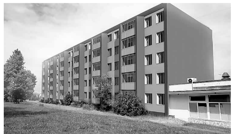
Vizualizācija – daudzdzīvokļu māja Maskavas ielā 1 pēc atjaunošanas.