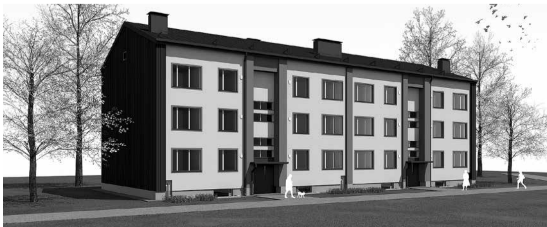
Vizualizācija – daudzdzīvokļu māja Miera iela 19 pēc atjaunošanas.