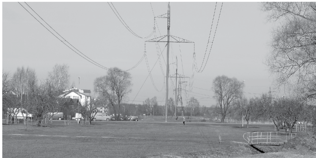
Šie elektrolīnijas kabeli tiks ierakti zemē, tādējādi padarot teritoriju ne tikai vizuāli pievilcīgāku, bet arī drošāku.

Tas nozīmē, ka, nomainot šīs elektrolīnijas, esošā teritorijā kļūst ne tikai vizuāli pievilcīgāka, bet arī drošāka iedzīvotājiem, jo kabeli tiks ierakti zemē. Tāpat, novācot neglītus stabus, iegūsim brīvu teritoriju, jo pagājušajā gadsimtā izbūvētā augstsprieguma gaisvadu