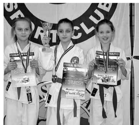
Lai gan pastāv uzskats, ka karatē ir vīrišķīgs sporta veids, sevi lieliski pierāda arī meitenes.