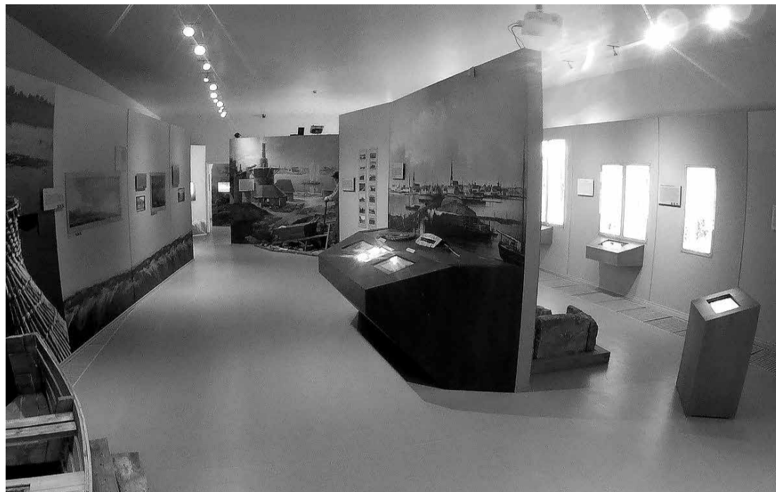
Jaunajā ekspozīcijā apmeklētāji var atklāt Salaspils vēstures stāstu jaunā un interaktīvā veidā.