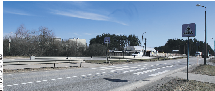
Gājēju pāreja uz Ziepniekkalna ielas (pie lielveikala „A7”).

Ielu un ceļu infrastruktūras sakārtošana ir viena no Ķekavas novada pašvaldības prioritātēm, tāpēc šogad šim mērķim pašvaldības budžetā paredzēti trīs miljoni eiro. Taču novadā ir ne tikai pašvaldības, bet arī valsts pārziņā esoši ceļi, kur veicami drošības un satiksmes uzlabojumi.