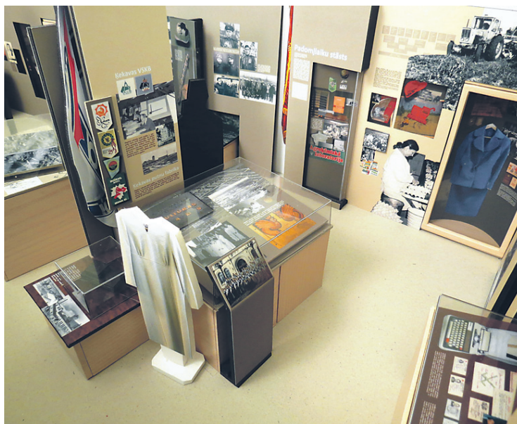
Jaunās ekspozīcijas koncepcijas dizaina makets.

Pēdējo gadu laikā ir veikti pētījumi par Pirmo pasaules karu un latviešu strēlnieku cīņu gaitām Ķekavas novadā, par Otrā pasau-