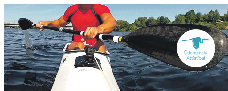
2017. gada 13. maijā

JAUNIEŠU MEISTARSACĪKSTES SMAIĻOŠANĀ UN KANOE AIRĒŠANĀ.