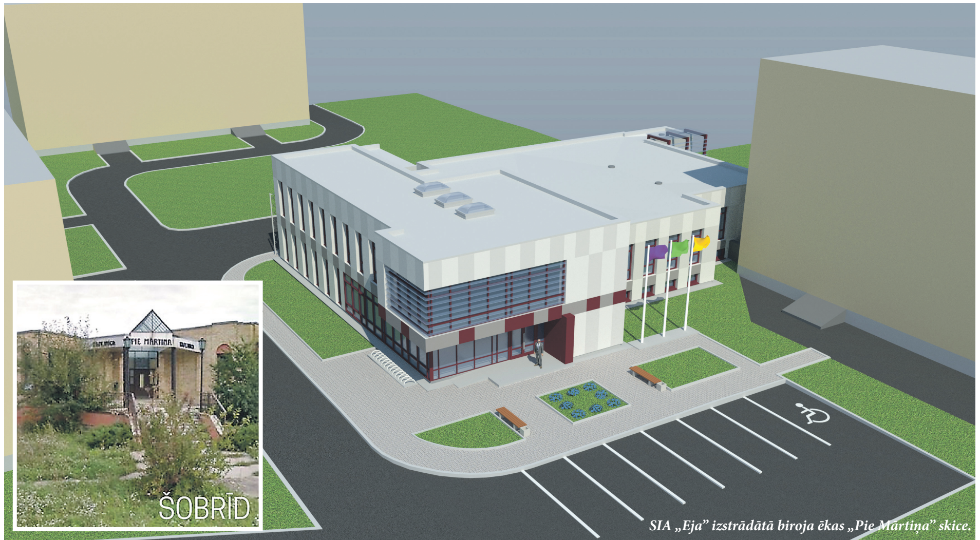
SIA „Eja” izstrādātā biroja ēkas „Pie Mārtiņa” skice.

Šobrīd ir izstrādāta biroja ēkas skice un izsludināts iepirkums par projektēšanas darbiem. Ēkā „Pie Mārtiņa” plānots izvietot Ķekavas novada pašvaldības Būvvaldes, Telpiskās plānošanas, Vides un Attīstības daļas speciālistus, kuri atbild par būvniecības procesa nodrošināšanu novadā.