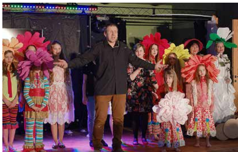
Bebrenē izskanēja muzikāla izrāde visai ģimenei “Aiz baltās rozēs smaržas”