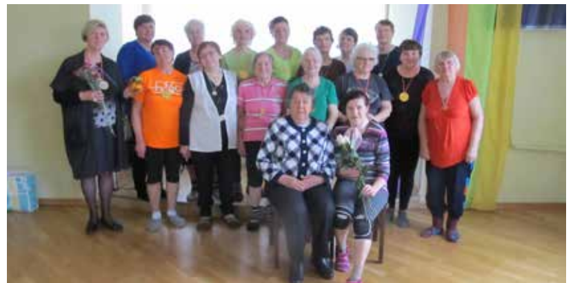
Veselības grupā „Palīdzi sev” regulāri aktīvi darbojas līdz 15 seniorēm