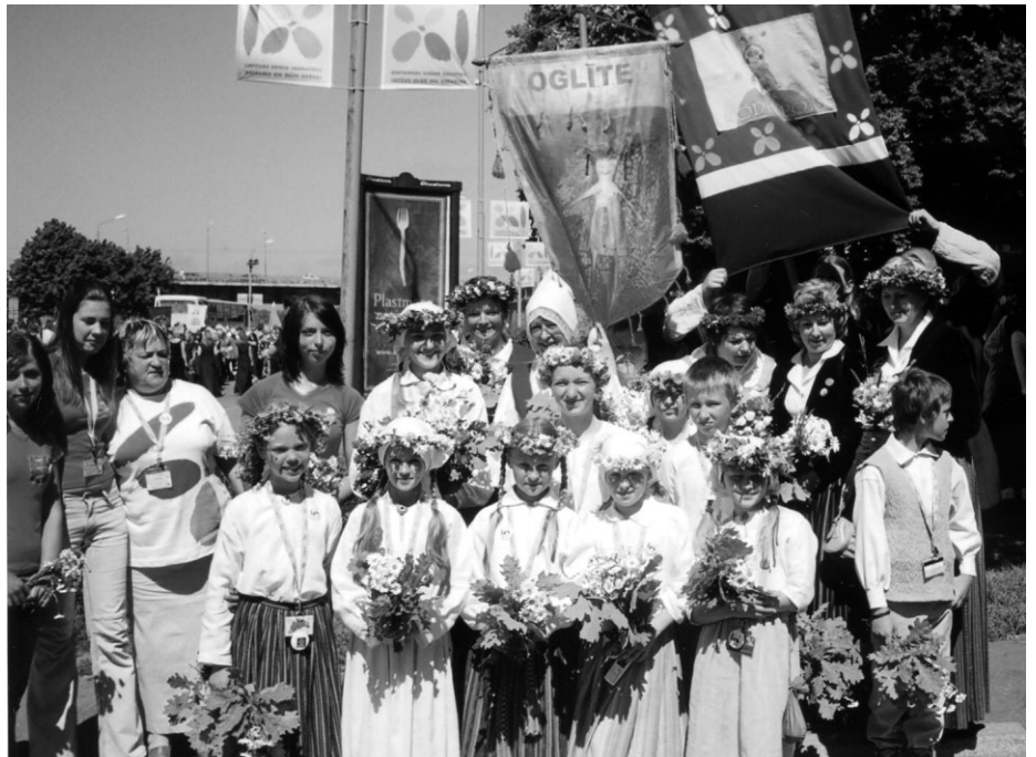
Ropažu novadu IX skolēnu dziesmu un deju svētkos pārstāvēja Zaķumuižas folkloras kopa „Oglīte” un Ropažu vidusskolas teātra sporta studija