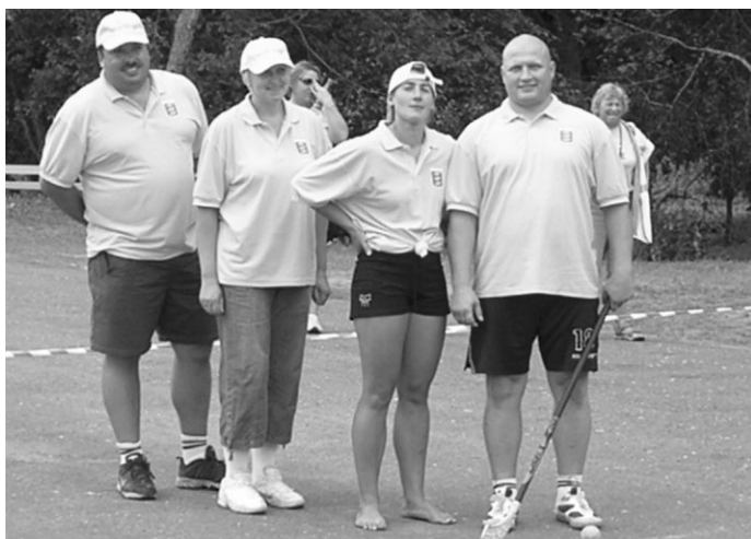
Florbulings – tas ir grūti, bet interesanti, atzīst mūsējie

Šajās sacensībās bija pilnīgi jauns sporta veids - florbulings kurā ar hokeja nūju līkloču jādzenā tenisa bumbiņu, beigās raidot to ķegļu rindā. Šeit daudz ko noteica veiksmīgs bumbiņas metiens pa ķegļiem un tas, cik daudz ķegļu apgāzīsies vienā reizē. Ropažniekiem izdevās izcīnīt 9.vietu.