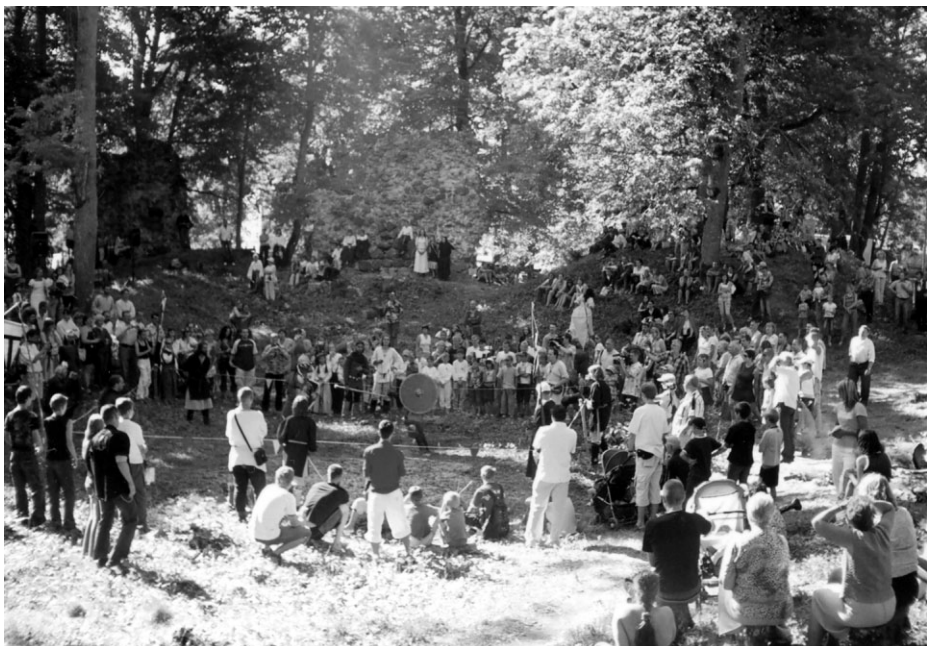
Viskrāšņākais notikums šovasar Ropažos – 800 gadu jubilejas pasākumi