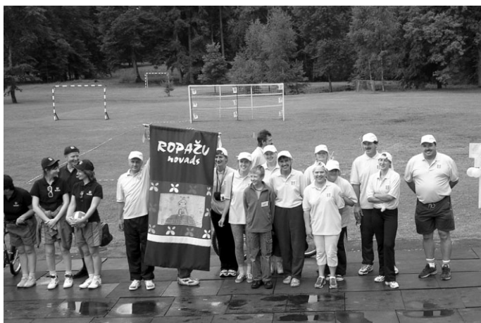
Ropažu novada domes deputātu un darbinieku komanda