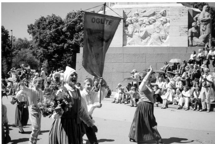
„Oglīte” braši pārstāv Ropažu novadu arī svētku gājienā