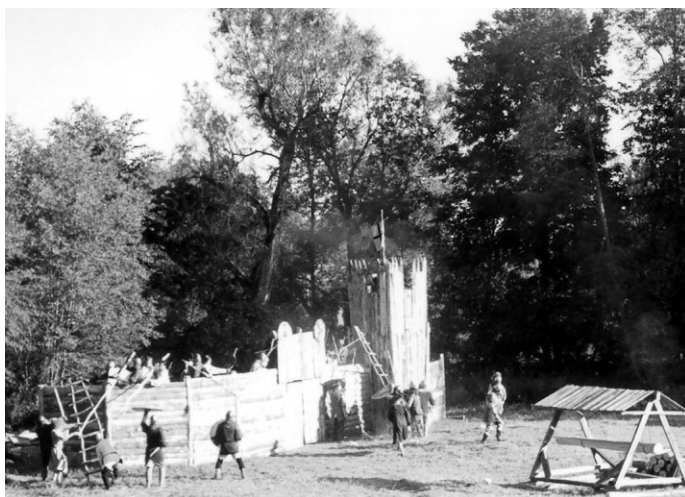
Nocietinājumu ieņemšana Lielās Juglas krastā

Par svētku gatavošanu bija domāts un gādāts ilgi un rūpīgi, programma bija daudzveidīga un interesanta, pat vakara noslēgumā, jau mierīgākā noskaņā, abās kafejnīcās vēl varēja pavadīt laiku klausoties Čaka dzejas motīvos vai arī baudīt Ķeņa un Pāvula dialoga pārsteigumus.