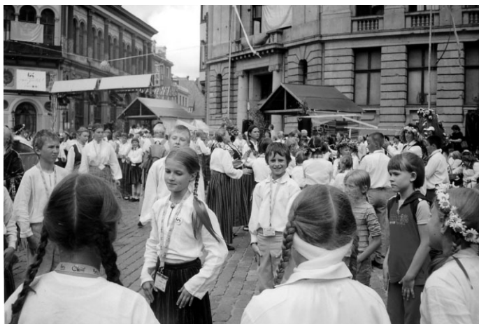
Danči Brīvdabas muzejā un Rīgā – Doma laukumā