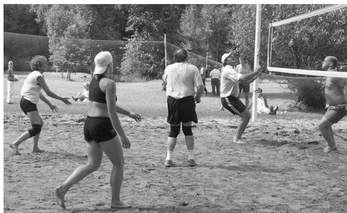
Ropažu volejbolisti spraigā cīņā tika pie 2.vietas kausa un medaļām

spēles galotnē bija neizšķirts rezultāts, cīņa par uzvaru bija aizraujoša, bet šoreiz veiksmē uzsmaidīja Ādažu pašvaldības komandai, atstājot spēcīgo Ropažu komandu 2.vietā.