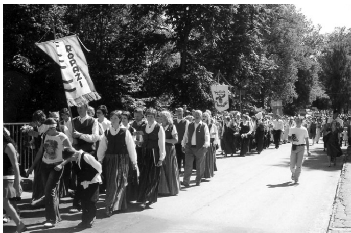
Svētku dalībnieku gājiens uz pilsdrupām

Ropažu 800- gades svinības iesākās ar svētbīrīdi baznīcā un amatnieku tirdziņu pilsdrupās. Ap pusdienlaiku visi svētku dalībnieki un pasākumu vērotāji pulcējās ciemata centrā uz gājienu, lai krāsainā vijā dotos garām vidusskolai un parkam uz senajām drupām un pēc tam atpakaļ uz estrādi, kur notika dalībnieku koncerts.