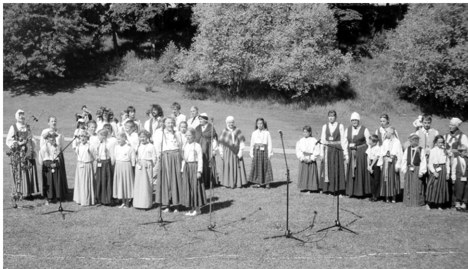
Turaidas Dainu kalnā Piedaugavas grupu vidū gavilē arī „Oglīte”