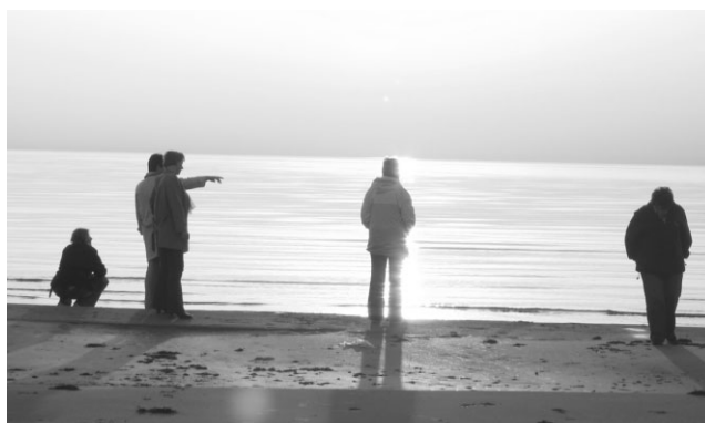
Semināra dalībnieki vakara pastaigā gar jūras malu

Ropažu novada dome pateicas par interešu izglītības kolektīvu un pulciņu vadītājiem, kuri šī gada laikā, strādājot ar saviem kolektīviem, sasnieguši ļoti labus rezultātus novada, valsts un starptautiskā līmenī. Dome izsaka pateicību visiem vecākiem, kuri atbalsta šos kolektīvus.