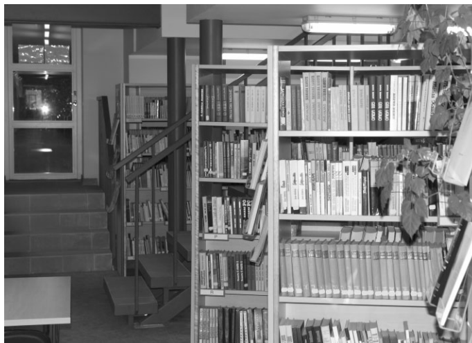
Bibliotēkas ieeja no skolas puses un kāpnes uz lasītavu augšstāvā