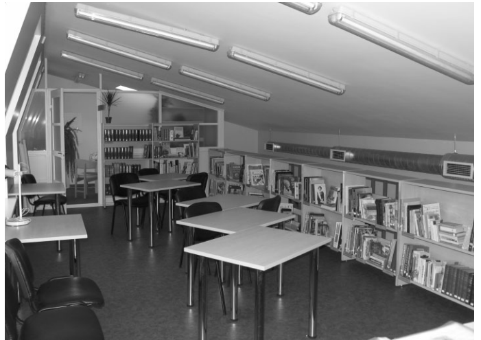
Lasītava ir neliela, toties ērta un mājīga

1994.gadā bibliotēka tika pārcelta uz Ropažu pagasta bērnu dārzu „Annele” (tagad Ropažu novada Pirmskolas izglītības iestāde „Annele”). Tur bibliotēka ar pārvietošanu no vienas telpas uz otru, kā arī bibliotēkas telpu samazināšanu atradās līdz 2005.gada vasarai, kad Ropažu novada pašvaldība nolēma izveidot Ropažu