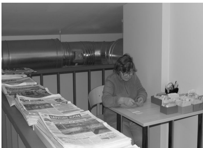
Birutai Ermansonei arī jaunajās telpās darba ir daudz

novada informācijas centra un pārvietot bibliotēku uz jaunuzcelto ēku starp Ropažu sporta centru un Ropažu vidusskolu.