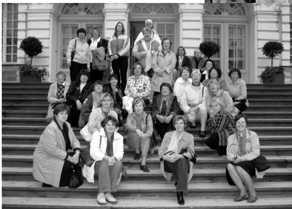
Pedagogi uz Rundāles pils kāpnēm

paaudzi pēc paaudzes strādājuši šo atbildīgo un skaisto darbu šeit Ropažos.