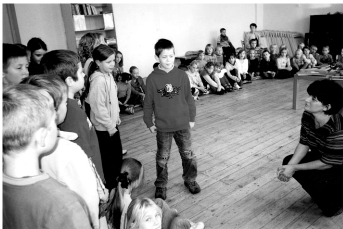
TAUTASDZIESMAS MARATONS sākumskolā. 3.b klasē bija vairāki skolēni, kuru dziesmu kamols bija garš jo garš...

Priekam un prāta asināšanai, kā arī uzmanības vingrināšanai un prasmei darboties komandā, trīs dienas pēc kārtas