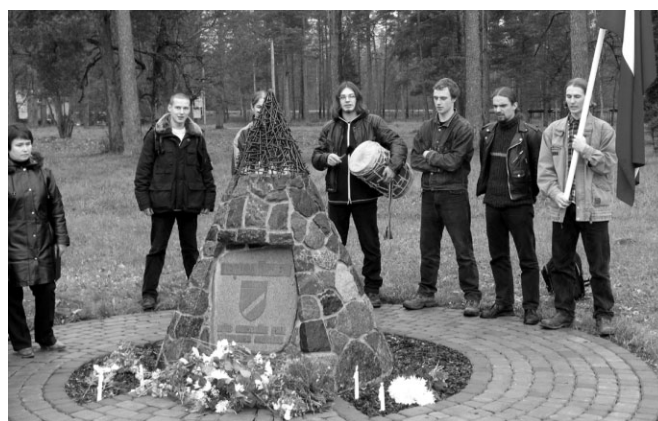
„Trejasmens” puīši dziedāja latviešu tautas dziesmas par karu