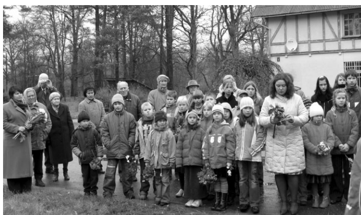
Piemīņas brīdī pie pieminekļa gan lielie, gan jaunā paaudze