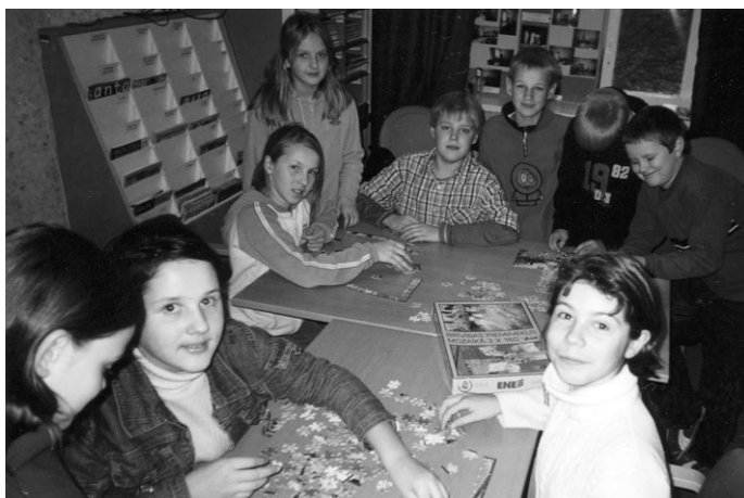
Minikonkursiņā “Brīvības piemineklis” 5.-ie cīnās ar smaidu uz lūpām. Ieguvēji ir visi, jo galvenā balva - PRIEKŠ.

pēc mācību stundām notika minikonkursiņš “BRĪVĪBAS PIEMINEKLIS”, kurā iespējami ātrākā laikā no 160 gabaliņiem bija