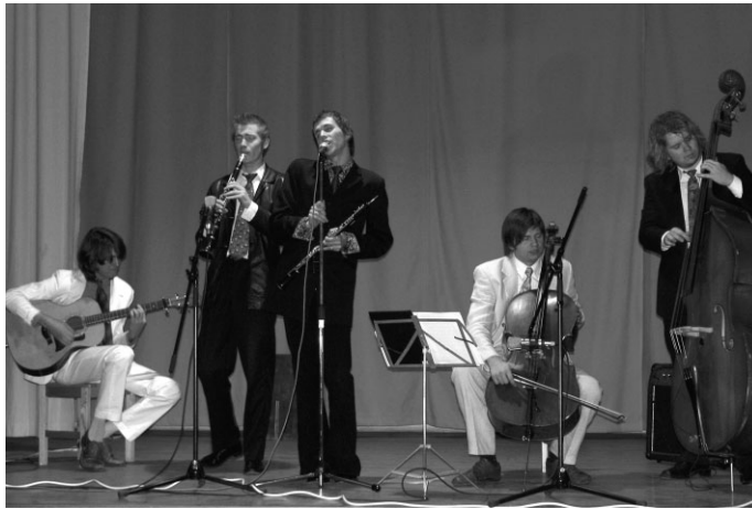
Mazliet neparasti muzicē „AUTOBUSS DEBESĪS”

Ir jauki, ka vecāki ved savus bērnus uz šādiem pasākumiem, taču pirms tam ir jāizstāsta mazulim, ka tas ir nopietns