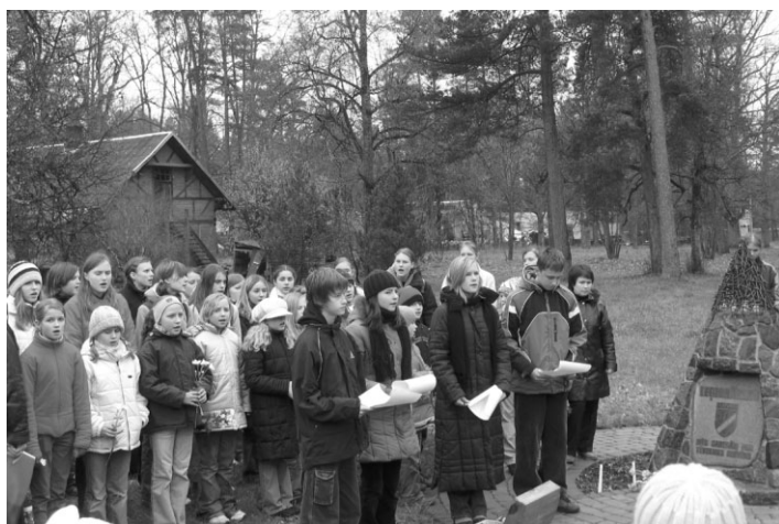
Uzstājās Zaķumuižas pamatskolas koris un teātra pulciņš