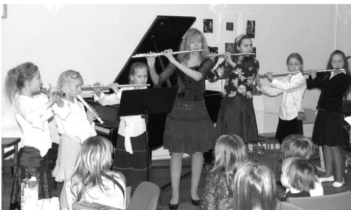
Pirmā kopīgā uzstāšanās flautistēm