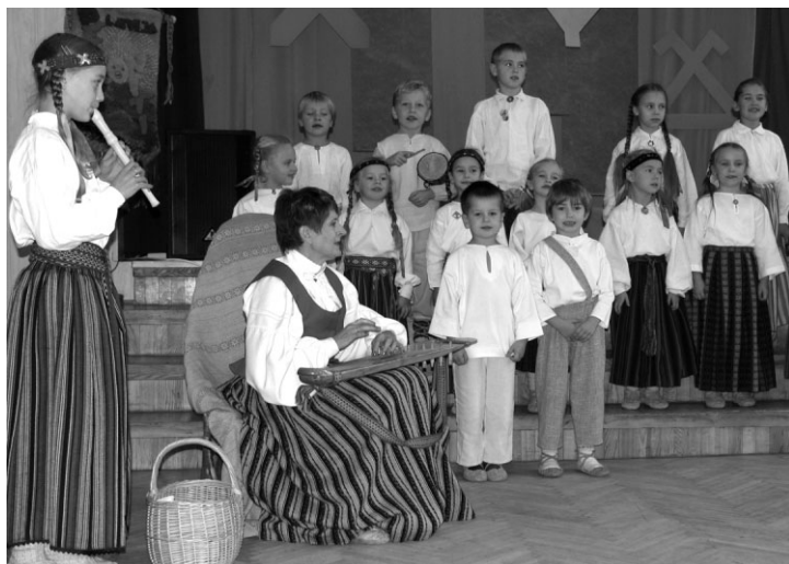
Kopā ar Ligitu uzstājas pašas mazākās „Oglītes”