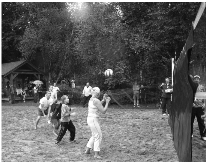
Ģimenēm jāsaņem neparastā volejbola spēlē