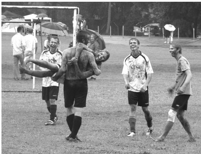
Lietus un dubļi – arī tie jauniešiem var sagādāt jautrību