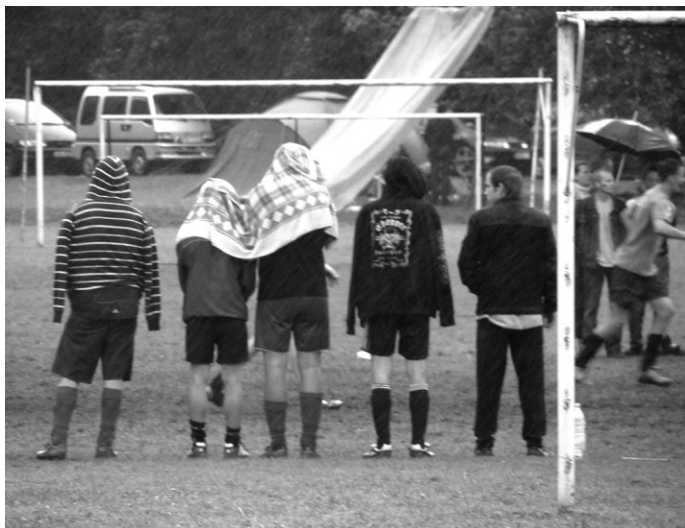
Futbola līdzjutēji – pacietīgi un draudzīgi