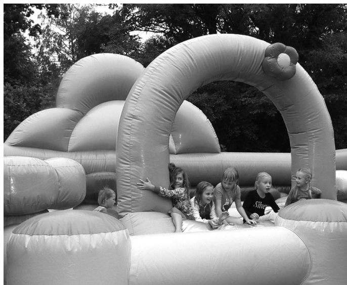
Slapji, bet laimīgi mazuļi izklaidējās piepūšamajā pilī Turpinājums 10.lpp.