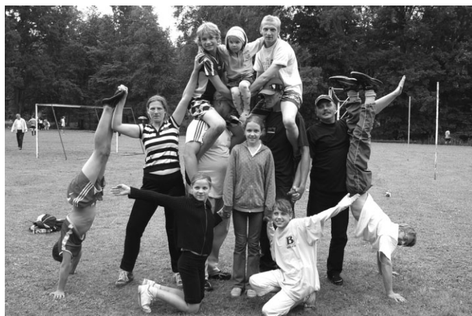
Jauna disciplīna – dzīvās piramīdas veidošana