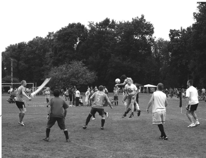
Vispopulārākais joprojām ir futbols