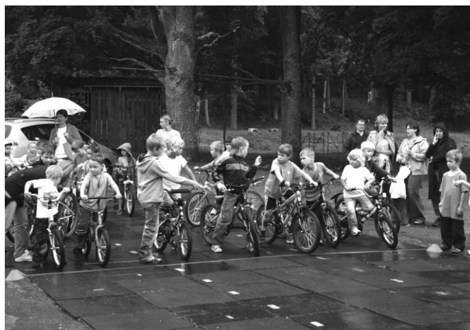
Tradicionālās junioru riteņu gonkas