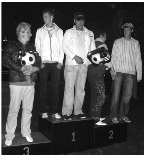
Uzvarētājiem futbolā balvās jaunas bumbas. Par visām balvām paldies sponsoriem!