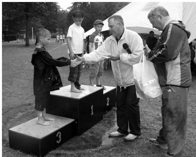
Bērni pirmie saņem sponsoru dāvētās balvas un diplomus