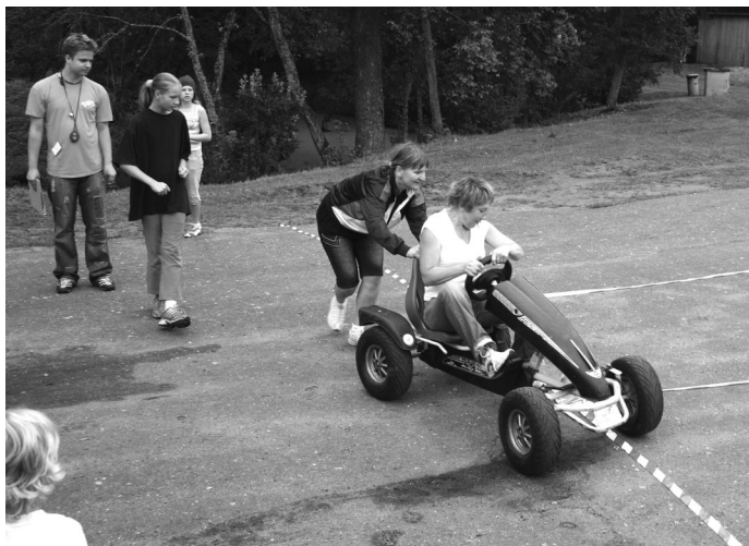
Autosacīkstēs šoreiz jābrauc ar gokartu