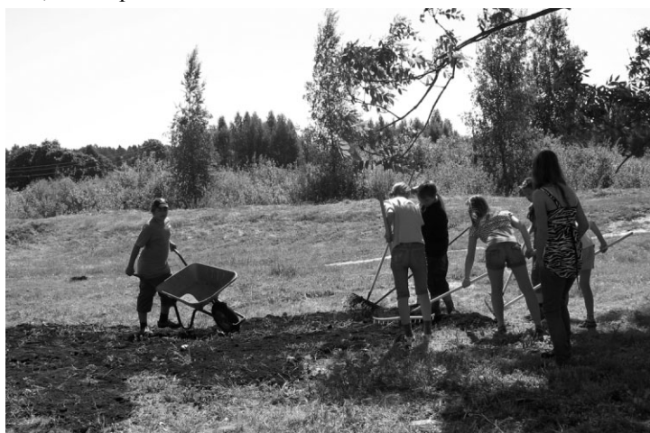
Ropažu novada Sociālais dienests