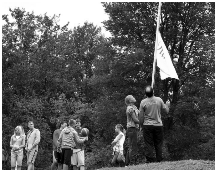
2007.gada uzvarētāji „Rasas” paceļ karogu