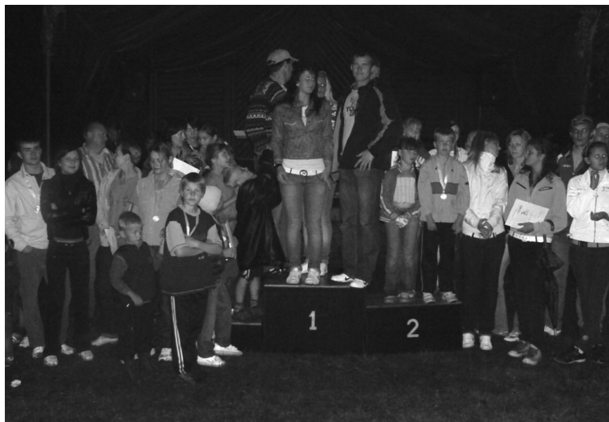
Apbalvošanas pasākuma kulminācija – uzvarētāji kopvērtējumā