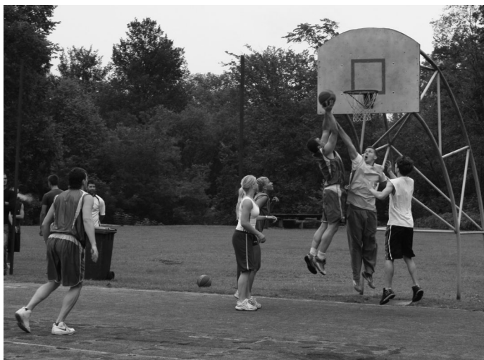
Strītbolu labprāt spēlēja daudzas komandas