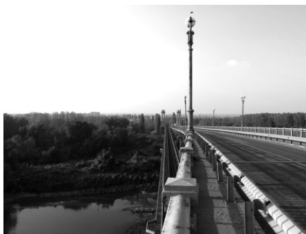
Tilts Rusē pāri Donavai

pārvadājumiem, tam ļoti nepieciešams remonts.