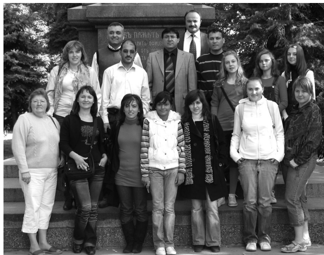
Latvijas pārstāvji kopā ar projekta dalībniekiem no Turcijas Ruses pilsētas parkā