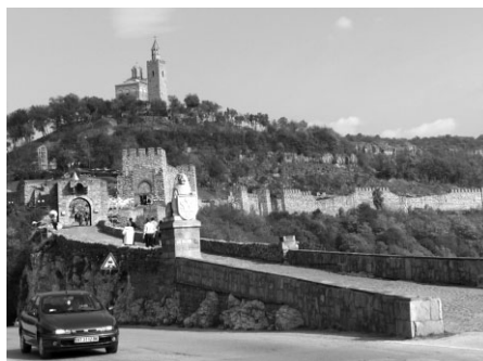
Senais cietoksnis Veliko Tarnovo

Nākamā dienā devāmies uz pilsētu Ruse, kas kādreiz padomju laikos bija Rīgas sadraudzības pilsēta. Rusē aplūkojām jūgendstilā celtās ēkas pilsētas centrā, ostas promenādi Donavas krastā, bijušo pasažieru ostu un kādreiz populāro dzelzceļa līniju, kas veda cauri pilsētai uz ostu. Piecdesmitajos gados Rusē tika uzbūvēts tilts pāri Donavai, kas savienoja Bulgārijas un Rumānijas krastus. Tilts nu jau krietni ir kalpojies starptautisko kravu