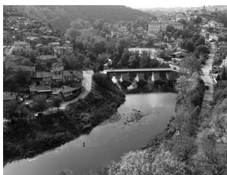
Skats no cietokšņa uz pilsētu