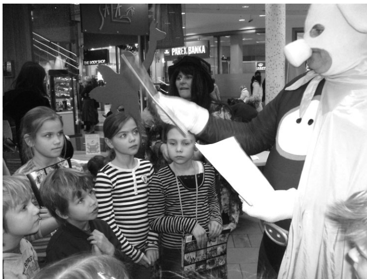
Cūkmens iepazīstina ar izdoto grāmatiņu