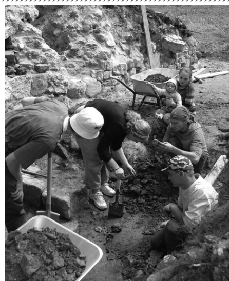
Tiek atrakts pils vārtu sliekšņa akmens

koka ēkas, par ko liecina atrastie pamatu akmeņi. Konstatētas arī līdz šim dabā nesazīmējamās šķērssienas, kas, pēc visa spriežot, celtas pēc Livonijas vai poļu – zviedru kara, mainot pils plānojumu. Noslēdzot arī, ka pils celta 12.-13.gadsimta lībiešu ciema perifērijā, bet pats lībiešu ciema centrs meklējams mācītājmuižas tuvumā. Tika atklāta vārtu vieta, kur par