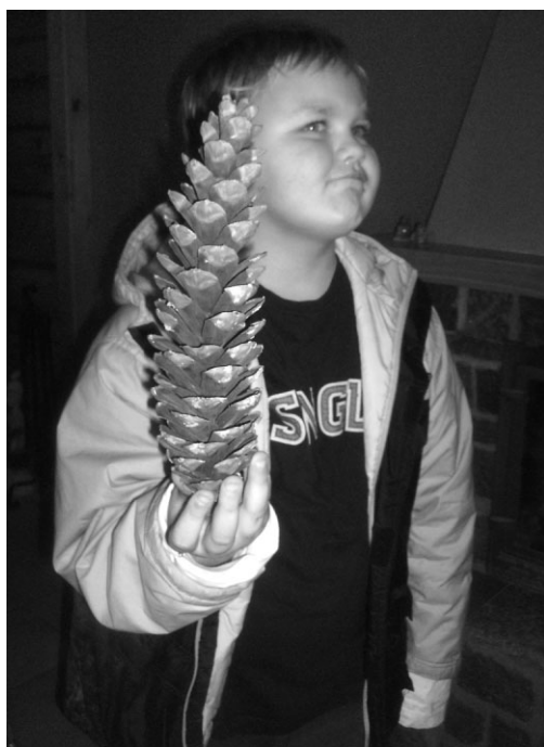
Tāds ir pats lielākais čiekurs!

„Sveķi”. Tur audzē šķirnes trušus, kazas un pīles. Aplūkojāms dažāds dzīvniekus un kāpelējām skatu tornī, kā arī pa trušu mājiņas trīs stāviem. Šīs atrakcijas radītas speciāli mazajiem ekskursantiem. Nu un tad jau izstāģājam Ģaiziņa mācību un skatu taku. Skaista ir mūsu Latvija, no augstāka skatu punkta raugoties!