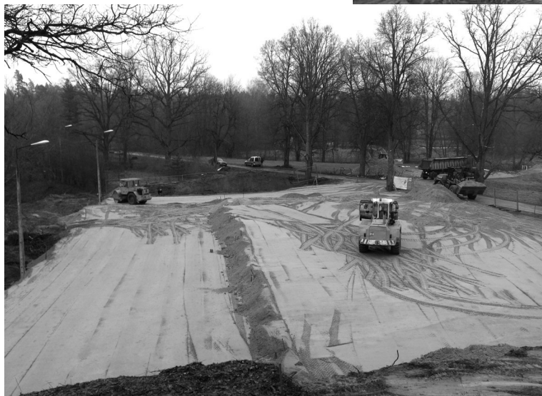
Skats uz būvlaukumu no skolas logiem

PIESARDZĪGI, NEATRODIETIES BŪVNICĪBAS ZONĀ, NEATĻAUJIET TUR ATRASTIES SAVIEM BĒRNIEM!