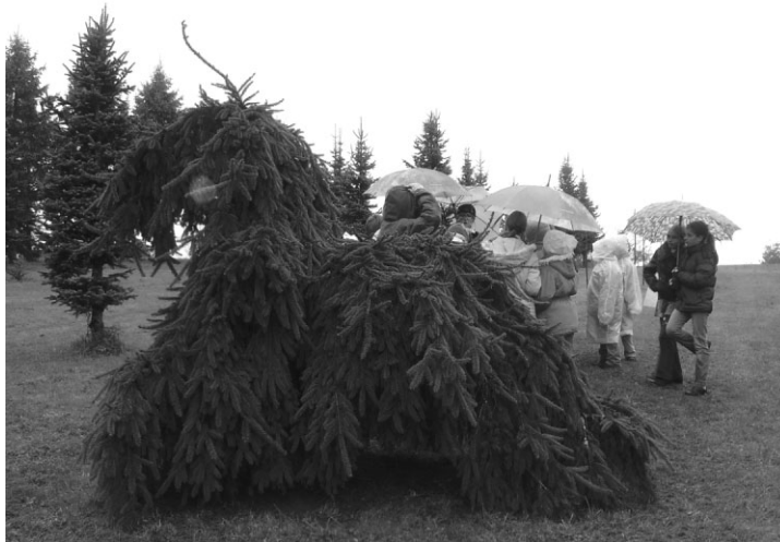
Skujeņu formu daudzveidība Kalsnavā

Pasākumos Rīgā esam tikušies ar Cūkmenu, Tērvetes meža Raganiņu, Kalsnavas Lielo Putnu, ornitoloģijas biedrības pārstāvjiem. Šajās tikšanās reizēs varam uzzināt daudz par norisēm dabā. Mēs skatījāmies filmu par aizsargājamo Zaļo vārnu, krāsojām putnus, iepazīnāmies ar putnu barošanās ķēdēm, klausījāmies putnu balsīs. Cūkmens prezentēja jauno grāmatu par sevi. Tā šobrīd nopērkama