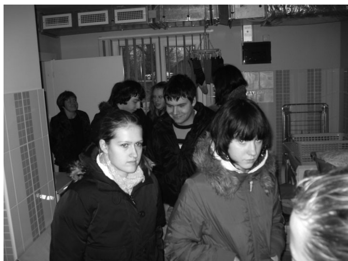
Ropažu novada pašvaldības Sociālais dienests