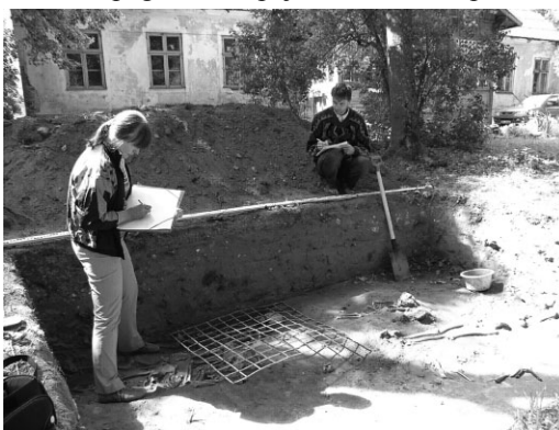
Pārbaudes izrakumu laukums viduslaiku baznīcas kapsētā- kaps tiek zīmēts un aprakstīts