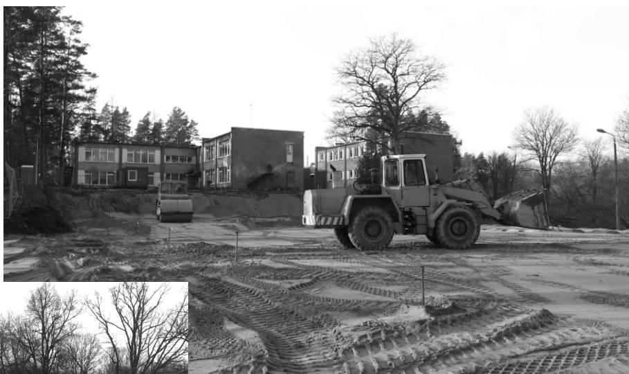
Būvlaukumā patlaban notiek smilšu uzberuma veidošana un līdzināšana