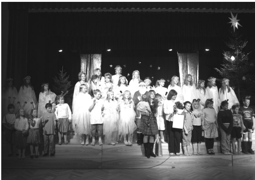
Ziemassvētku uzveduma „Pasaka par brīnumvecīti” dalībnieki

Paldies vecākiem un audzēkņiem par aktīvo līdzdalību izrādes tapšanā. Visiem pārējiem skolotājiem liels paldies par ieguldīto darbu Ziemassvētku koncerta, izstādes tapšanā, kā arī par ikdienas darbu ar audzēkņiem, to gatavošanu uz konkursiem.