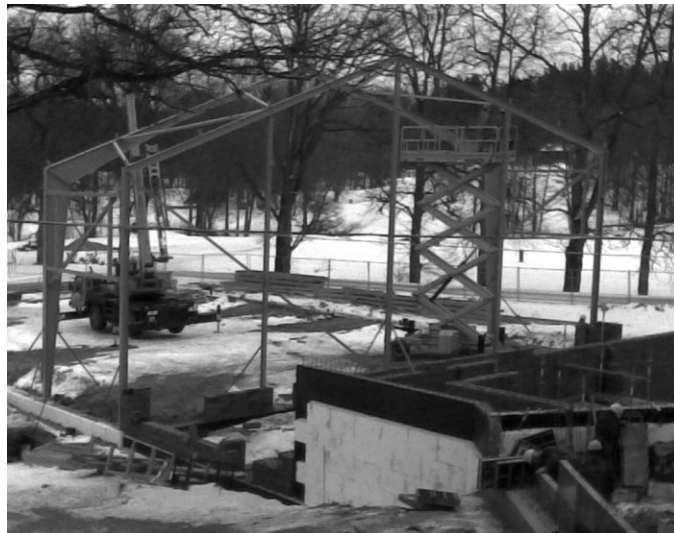
Marta pirmajās dienās jau manāmas sporta zāles aprises