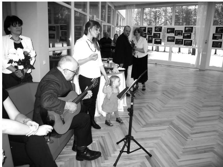
Mirkļis no izstādes atklāšanas