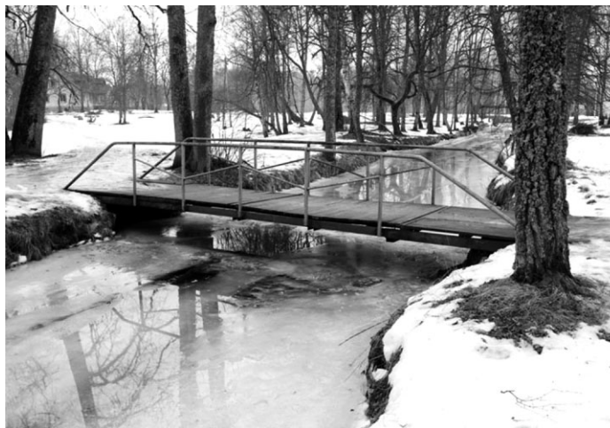
Tāds patlaban izskatās tiltiņš Ropažu parkā