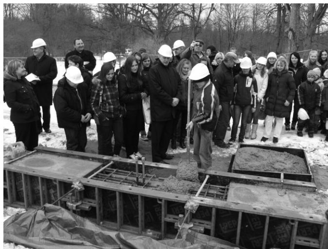
Īpaši aizrautīgi kapsulas iemūrēšanu veica skolēni – galvenie sporta zāles izmantotāji