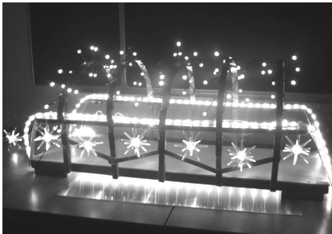
Šādi tumšajās stundās tiltiņu varētu izgaismot