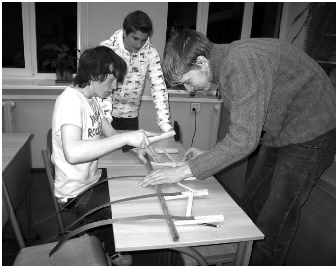
Skolēnu komanda darba procesā