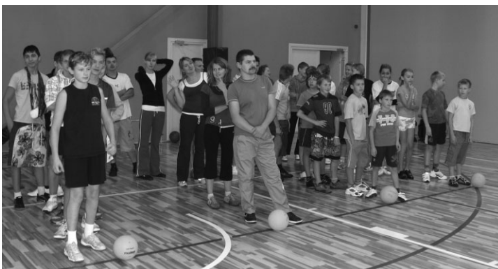
Komandas gatavas startiem stafetēs

noorganizētas, arī pieaicinātie tiesneši – skolotāji, kuri nestartēja komandā, godprātīgi fiksēja visus rezultātus. Nobēigumā sacensību organizatori pateicās visiem dalībniekiem par