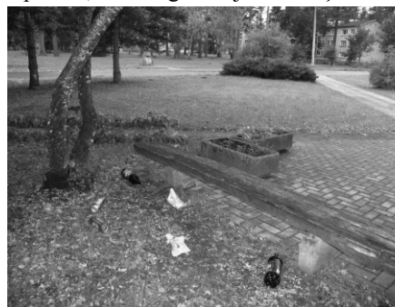
Pēc kārtējā vakara „tusiņa”

Staigājot pa ciematu, rodas iespaids, ka Zaķumuižā nekas nedrīkst būt sakopts un skaists. Noslaucīta iela vai pagalms, fui - cik tīrs, jāpiedražo ar papīriem, izsmēķiem. Jauni, skaisti celiņi, - noteikti jāapzīmē , jo kur gan nabaga cilvēkbērns lai citur izpaužas, kā vienīgi zīmējot uz celiņa flīzēm, autobusu pieturvietas un māju sienām?!