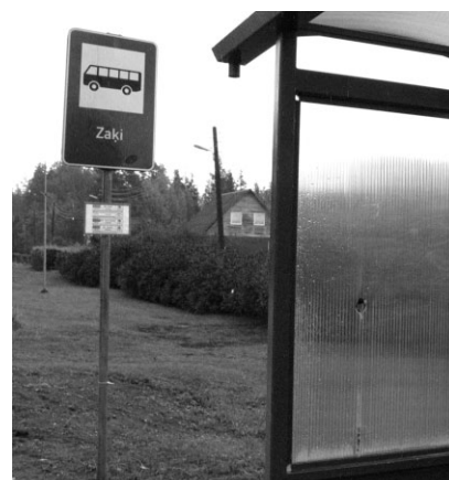
Tikko uzstādītās jaunās pieturvietas, bet jau „piecūkotas”

Tā, re, pie mums Zaķumuižā! Un kā pie Jums?!