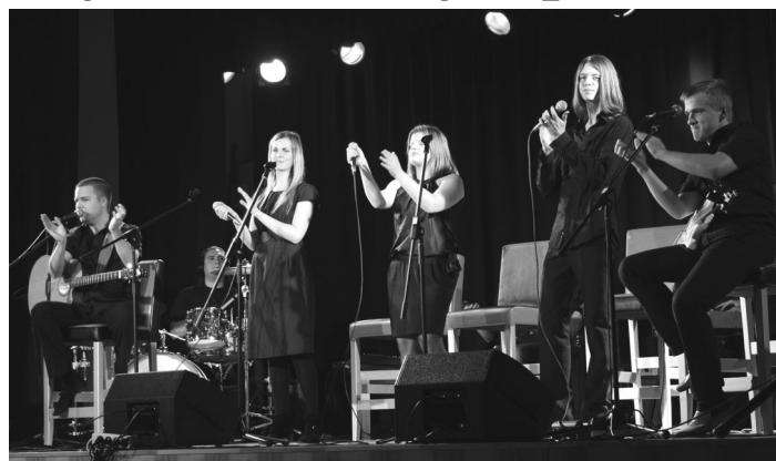
Grupa „Putnu balle” uzstājas koncertā Ropažos

Toreiz, 1966.gadā, kad tika pieņemtas rekomendācijas par skolotāju statusu, pirmo