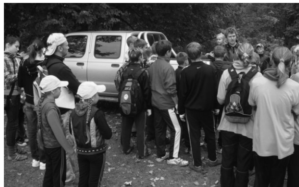
Sacensību organizatori iepazīstina ar noteikumiem