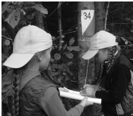
Atrasts viens no kontrolpunktiem

Sniegu gaidot, stiprie un drosmīgie tikās Bajāros, lai noskaidrotu labākos meža taku, dažādu šķēršļu pārvarēšanā un rēbusu risināšanā. Labākās sekmes dalībnieki demonstrēja tajos uzdevumos, kur varēja izmantot „Magnēta” pieredzi. Nestandarta