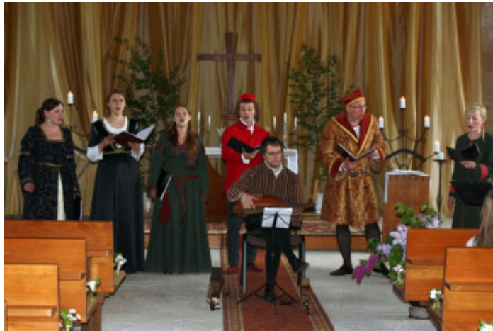
Ansamblis LIRUM koncertē Ropažu baznīcā

Senās mūzikas ansambļa mūziķi ir domubiedri, kuri kopā muzicē jau septiņus gadus. Ansambļa repertuārā ietilpst gan Eiropas tautu tautas mūzika, gan renesanses laika komponistu sarakstītie skaņdarbi (14. – 16.gs.). Ansamblis Lirum izpilda vokālo mūziku a cappella stilā un vokāli ar instrumentālu pavadījumu.