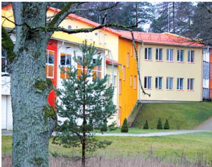
Zaķumuižas pamatskola 2012. gada ziemas brīvdienās

Zaķumuižas pamatskolas logo viens otram acīs skatās balts un melns zaķis. Tāda divu zaķu badišanās, tāda stīvēšanās, rīvēšanās, tāds melnais pret tādu balto. Tā es pieceļos no rīta un tu piecelies ar'. Un abiem ausis baltas un tīras. Bet vakarā, redz, man ausis melnas un tev ar' nedaudz. Melu putekli vai nevarības sodrēji, gljēvulības pelni un nolaidības dubļi. Bezrakstura diena bijusi.