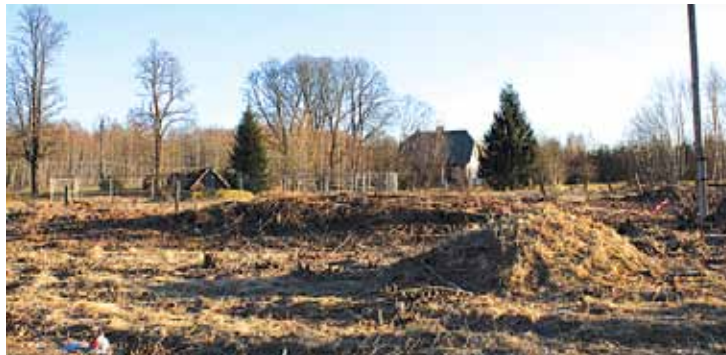
Iepilnnotā BMX trases vieta

matos, vingrošanas laukumi senioriem, nodrošināts apgaismojums parkos aktīvās atpūtas cienītājiem, peldbaseins kā produkts, šautuve, BMX trase, sporta komplekss "333" kā superprodukts , Lielā Jugla kā iespēja piesaistīt makšķerēšanas un laivošanas entuziastus. Dažādas aktivitātes mežā – riteņbraukšana, nūjošana, off road braukšana, orientēšanās, slēpošana. Novadā var rīkot treniņnometnes kā vasarā, tā arī ziemā gan profesionālajiem sportistiem, gan entuziastiem, taču tas prasa atbilstošu sporta bāzu esamību un nakšņošanas iespējas. Vairāki lieli regulāri un tradicionāli pasākumi ne tikai novada, bet