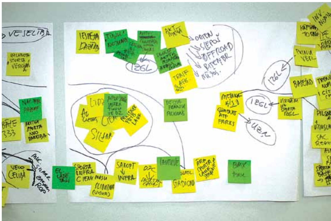
Darba grupas ideju siena.

Šobrīd jau notikušas pirmās tematisko darba grupu sanāksmes, kurās piedalījušies gan paš-