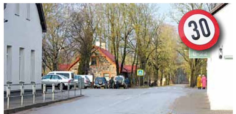
Paredzamais braukšanas ātrums Ropažu centrā

Vienlaikus tika lūgts koriģēt zīmes "Dodiet ceļu" atrašanās vietu Tumšupes un SAC "Ropaži" krustojumā un uzlabot satiksmes organizāciju krustojumā ▶ 2. lpp.