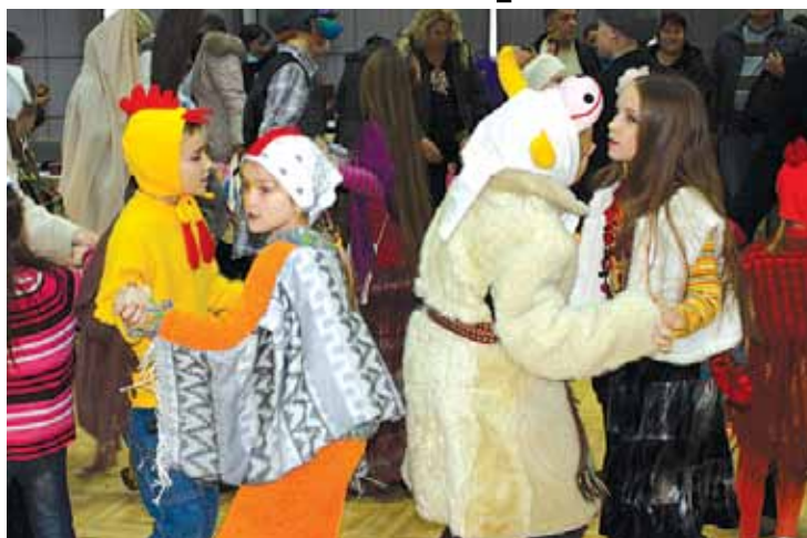
Budēļi Ziemassvētku tirdziņā

Ari jaunajā gadā Ropažu KIC piedāvās kvalitatīvu un interesan-