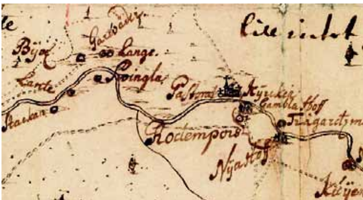
Pilsciema pagasta teritorija. 17.gs. zviedru karte