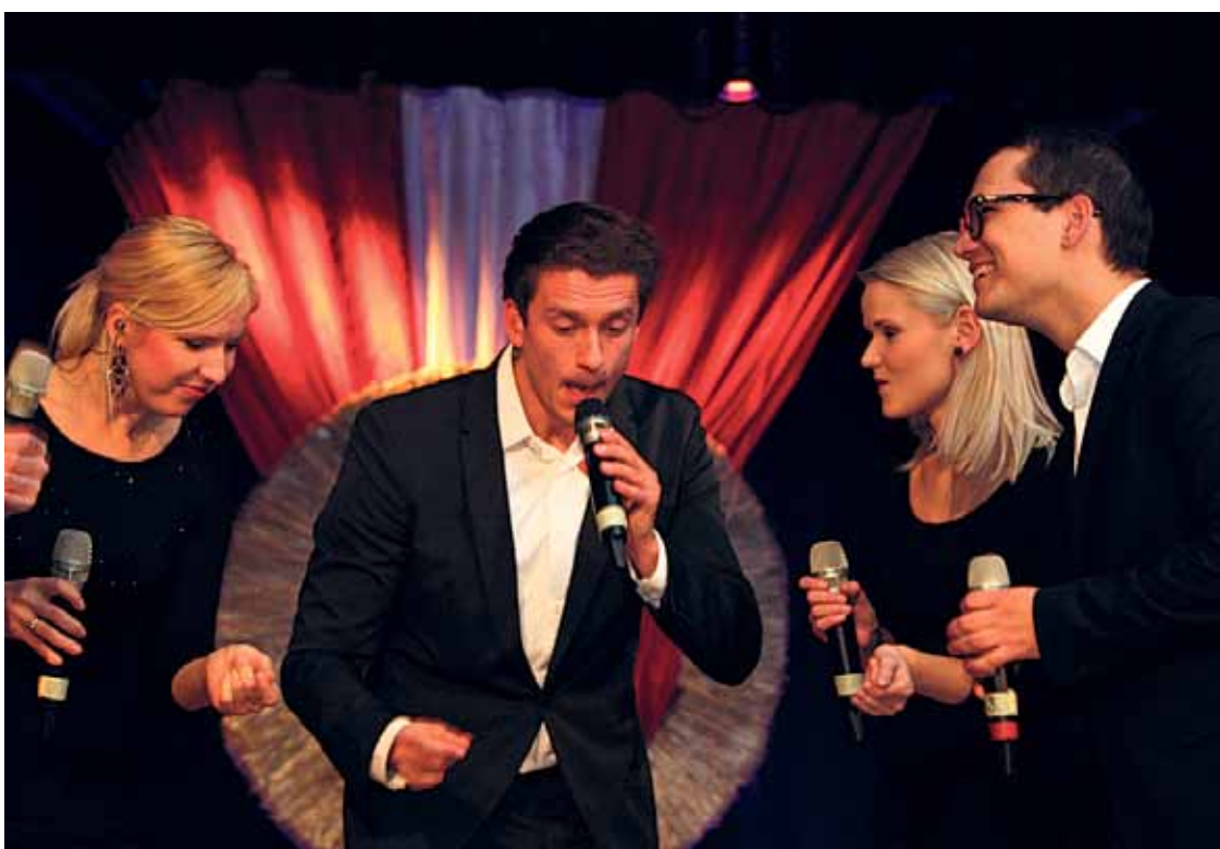
Neaprostāmi savīļņojošu koncertu sniedza vokālā grupa „Framest”