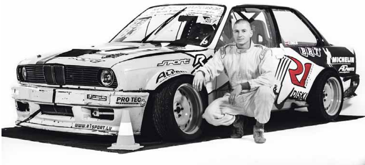
Ar mašīnu braucu jau no sešu gadu vecuma.

– Iepriekšējā sezonā braucu street klasē, tā ir vairāk iesācēju klase. Pirmajā sezonā ieguvi 3. vietu, šogad pro klasē 1. vieta