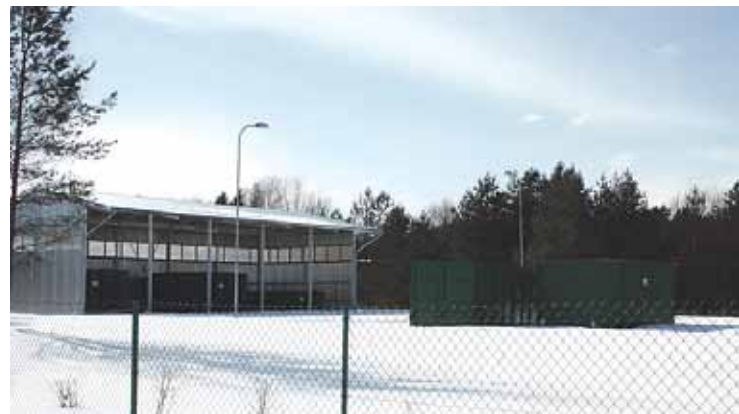
Atkritumu šķirošanas laukums Taurēnos, Zaķumuižā.

Zaļās krāsas konteineri – stikla atkritumiem. Tajos drīkst mest: stikla burkas, pudeles, kā arī logu stiklu. Pirms mešanas burkas un pudeles jāizskalo no ēdienu un dzērienu paliekām. Zaļajos konteineros nedrīkst mest: netīru stikla taru, spoguļu stiklu, automašīnu stiklu, pudeles, kas satur plastmasas piemaisījumu.