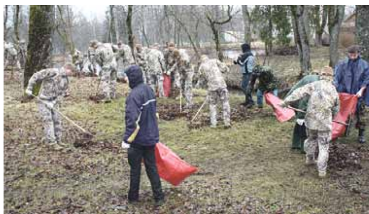
Ropažu novada teritoriju ieradās sakopt brašs karavīru pulciņš.