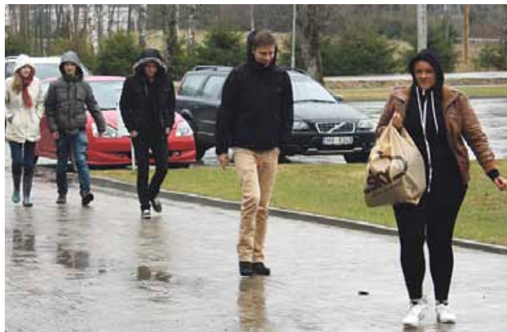
Lietu un vēju nebijās čaklie Banku augstskolas studenti.