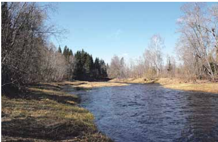
Lielā Jugla pie Augšciema 2011. gada pavasarī