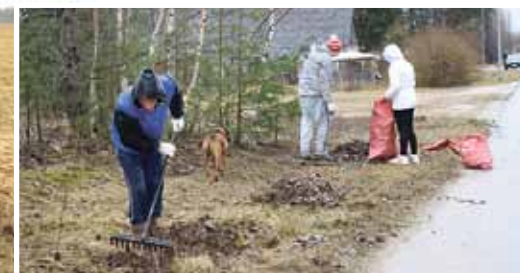
Kākciena aktivisti neslēpj prieku un entuziasmu pat šajā lietainajā dienā. Padarīts tiešām daudz.