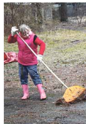
Cītīgākais talkotājs Muceniekos