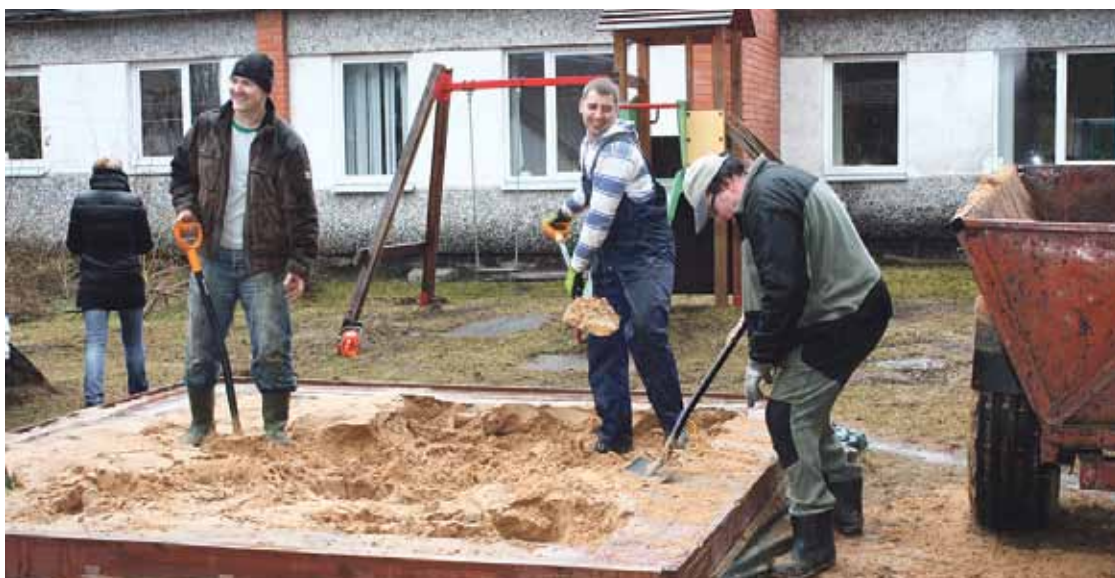
Zaķumuižas pamatskolā talkotāji čakli strādāja pirmsskolas izglītības grupu rotaļu laukumā.