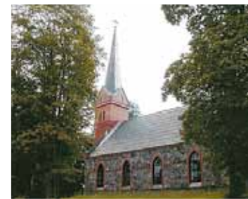
Ropažu novada Evaņģēliski luteriskā baznīca

– Manuprāt, tā ir vienaldzība, neieinteresētība, tuvredzība. Paldies Dievam, tas pazūd tādos īpaši kritiskos brīžos. Gads pagāja ar smagu pārbaudījumu Zolitūdes traģēdijas sakarā, un arī pēc tam redzējām, ka mēs esam ļoti gatavi saprast, atbalstīt, palīdzēt gan ziedojo, gan uz vietas viens otram kalpojot nesavtīgi, gan bez pašmērķa sniedzot tīri praktisku palīdzību. Šādos brīžos es redzu, ka mēs tomēr esam spējīgi uz kaut ko tādu un neesam vienaldzīgi. Bet mani priecē, ja tā būtu ikdiena – savstarpēja atsaucība un ieinteresētība pastāvīgi un visās jomās. Arī tajā pašā būvniecības jomā – lai mēs lietas darītu pavisam godprātīgi un pēc vislabākās sirdsapziņas. Redzot, ka otrs blakus grib nohaturēt, kas var novest pie bēdīgām sekām (un ne tikai celtniecībā, bet jebkurā lietā – kaut vai tas būtu papīru lietā, kur rodas zaudējumi uzņēmumam, pašvaldībai, valstij), mēs nevis norājam, bet esam gatavi iet palīgā. Katru dienu un visās jomās. Mums jāatbrīvojas no egocentriska vienaldzīguma, kad domājam tikai par sevi – pēc manis kaut vai ūdens plūdi... Pēdējo laiku notikumi rāda, ka ir jāatver acis un jāpaskatās, kā dzīvojam, kā attiecamiem pret ģimeni, pret darbu un cik tas ir godprātīgi.