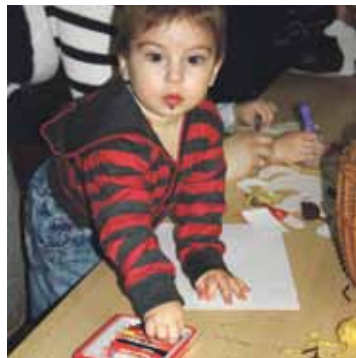
Draugi domāja, ko zirdziņam uzdāvināt.