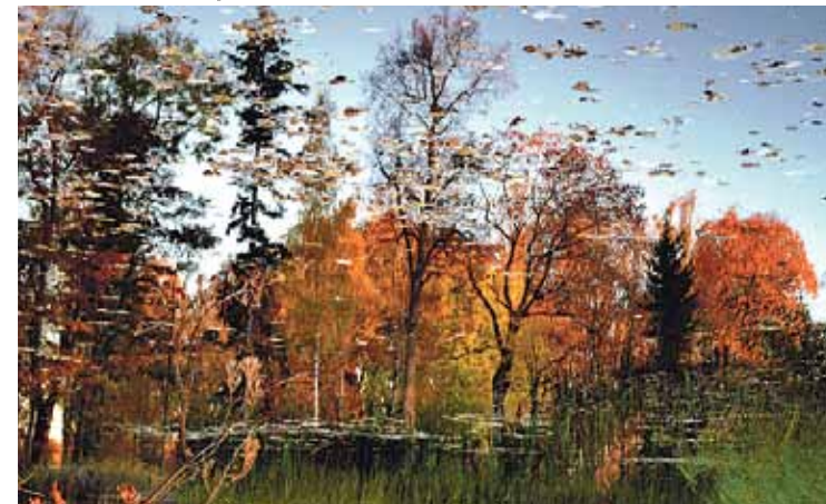
Ropažu novada bibliotēkas simpātijas balvas ieguvējas Elitas Strazdiņas foto

Izsakām pateicību autoriem, kas atsaucās uz bibliotēkas aicinājumu, iesūtot fotogrāfijas, kuras ataino Ropažu novadu visā tā krāšņumā. Ceram, ka jau šobrīd jums ir padomā fotogrāfijas, kuras iesūtīt 2014. gada fotoakcijai.