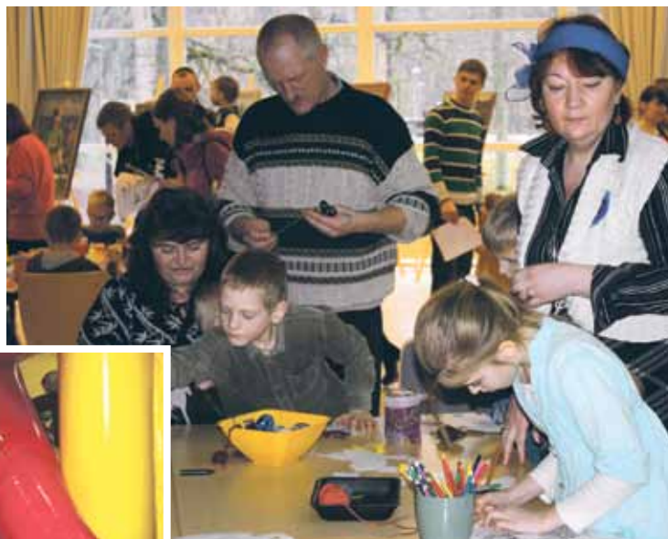
... gan izkustināt pirkstiņus