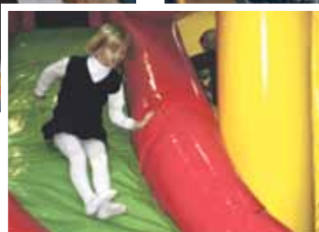
Brīvos brīžos varēja gan nolaisties pa kalniņu...