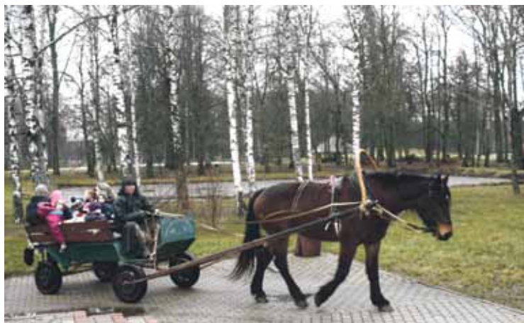
Kā jau Zirga darbnīcā – īsts zirgs!