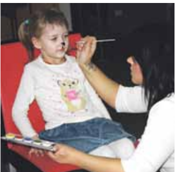
Katrs no atnākušajiem varēja pievienoties Zirga draugu – dzīvnieku – pulciņam...

Šogad ciemos pie Zirga un viņa draugiem Ropažu Kultūras un izglītības centrā bija sanākuši gan lieli, gan mazi. Visi čaki darbojās dažādās radošās un aktīvās darbnīcās, kā jau Zirga gadā pienākas. Ielūkosimies fotogrāfijās, kā tad mums gāja Zirga darbnīcā!