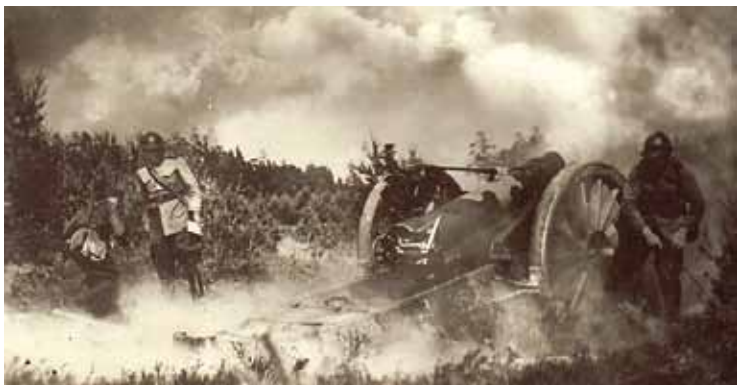
Latgales artilērijas pulka, kurā dienēja arī Jānis, apmācības. 20. gs. 30. gadu vidū.