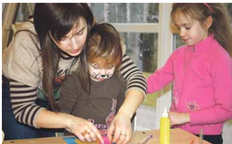
Draugi nāca kopā ar palīgiem