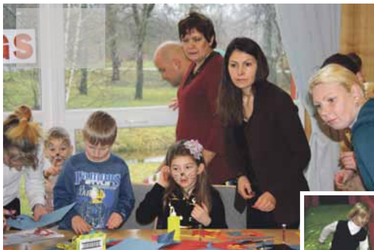
Čaklo roku pulciņš auga arvien lielāks