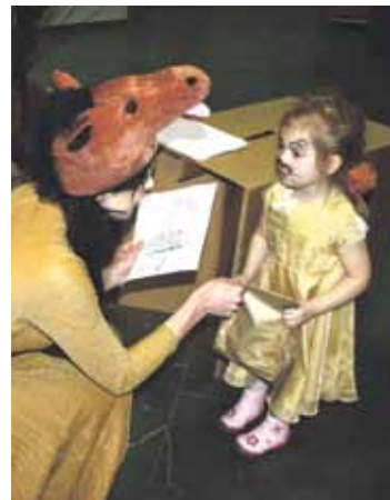
Kad darbi padarīti, tad pats jaukākais – dāvanas!

Šogad ciemos pie Zirga un viņa draugiem Ropažu Kultūras un izglītības centrā bija sanākuši gan lieli, gan mazi. Visi čaki darbojās dažādās radošās un aktīvās darbnīcās, kā jau Zirga gadā pienākas. Ielūkosimies fotogrāfijās, kā tad mums gāja Zirga darbnīcā!