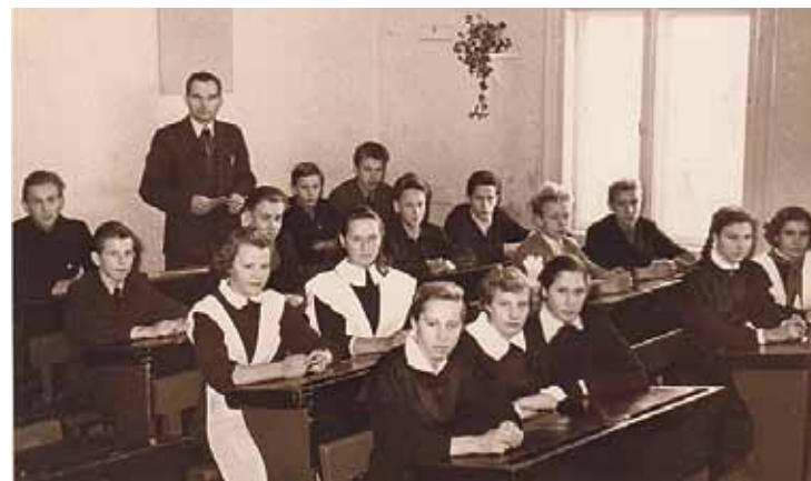
Skolotājs Ropažu vidusskolā 20. gs. 60. gadu beigās.