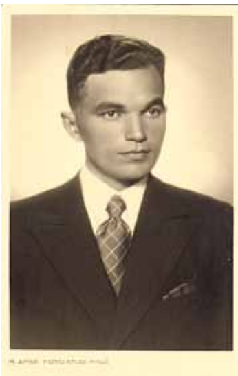
25 gadu vecumā.